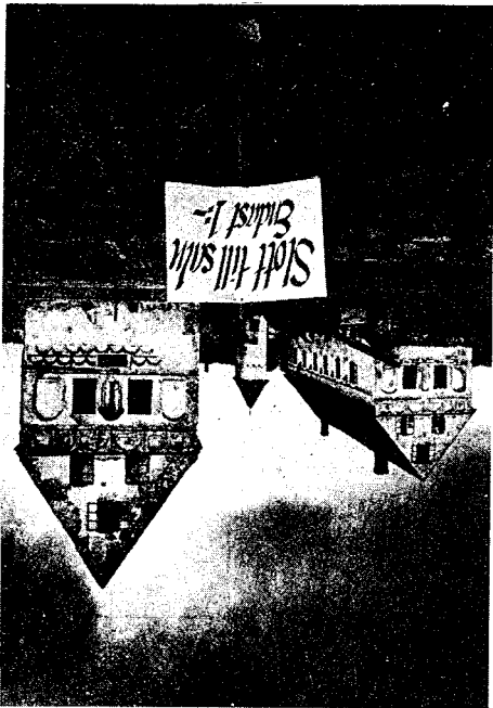
I en vecka har Bjergsjöholms slott varit till salu för det facta priset en krona, men ännu har ej slottets framtida öde avgjorts.