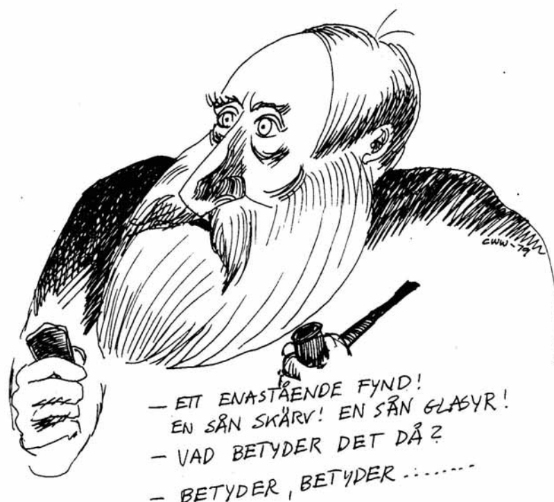
Figur 1: "Betyder, betyder..." Tegning i META 1979 nr. 1 av Claes Wahlöö

Hvilken betydning har et funn? Og hva betyr det at arkeologisk kunnskap skal være samfunnsrelevant? Slike og lignende spørsmål var den første META-redaksjonen opptatt av, og vi ville gjøre noe mer med det enn å la diskusjonen begrense seg til deltakerne rundt lunsjbordet i Krafts Torg 4. Vi opplevde disse spørsmålene av grunnleggende betydning for hvordan middelalderarkeologien ble drevet i felt og bak skrivebordet, for det var middelalderarkeologiens ve og vel, dens innhold, praksis, seriøsitet, aksept og innflytelse det hele handlet om. META skulle være et verktøy for å fremme dette målet gjennom å tilby