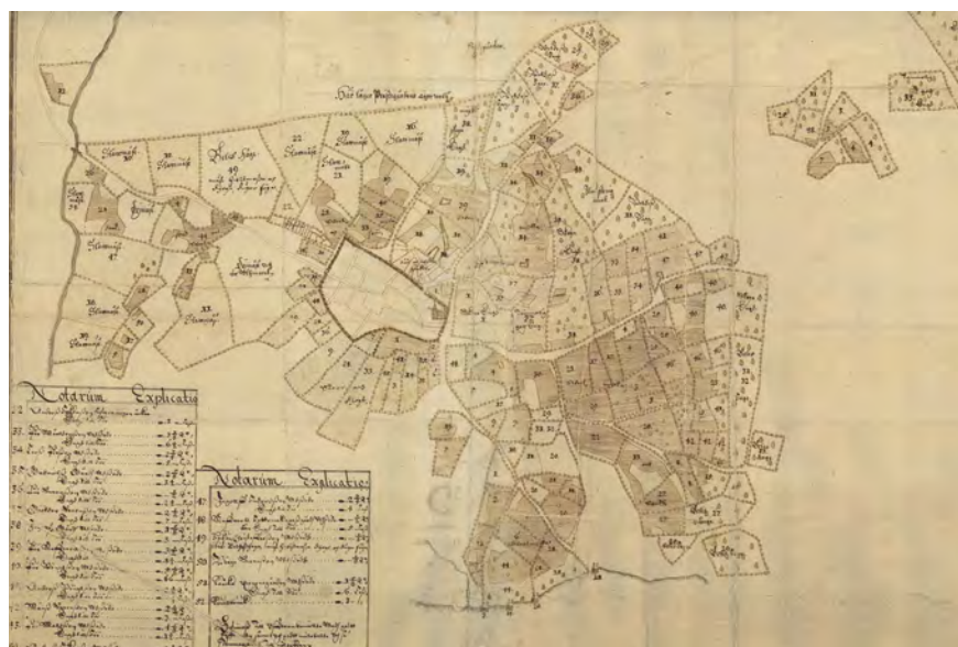
Figur 2. Geometrisk delineation över Vimmerby 1648, som visar stadsplanen med kyrkan i öster och torget i centralt placerat i staden. Lantmäteristyrelsens arkiv G105-1:1.

Den ska då ha varit av timmer och ha legat strax väster om nuvarande kyrka. Några andra medeltida institutioner bortsett från kyrkan fanns troligen inte i staden (Åhman 1984, s. 13). Hade inte det skriftliga källmaterialet om Vimmerbys medeltid varit bevarat hade orten utifrån de materiella lämningarna aldrig kunnat påvisas som stad. Visserligen konstateras det ofta i de undersökningar som gjorts i Vimmerby att äldre kulturlager varit sönderschaktade, men hade det funnits en omfattande tät medeltida bebyggelse på platsen borde man i alla fall ha hittat några fler lösfynd av medeltida karaktär.