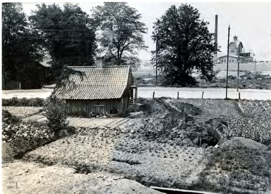
Figur 2. Gamlestaden var fortfarande ett mycket lantligt område i början av 1900-talet. Fotot är taget av Sixten Strömbom 1918 och visar "kyrkogårdsschaktet". I bakgrunden ser vi Marieholm och Slakthuset. Foto i GSM:s arkiv.

tomterna (Öbrink & Rosén in press). Några borgare tycks ha stannat kvar för att bevaka sina intressen och sina förråd. Under Kalmarkriget 1611–1613 blev själva staden tidvis ett slagfält och mer än hälften av borgarna flydde eller flyttade. Först 1619, då den andra Älvsborgs lösen hade erlagts och staden åter kom under svensk överhöghet, flyttade folk på allvar tillbaka till staden. Men under tiden hade Gustav II Adolf börjat smida planer på en ny stad, en stark fästning för den militära stormakten och samtidigt en plats dit främmande köpmän kunde lockas att etablera sig. Särskilt holländska handelsmän, med sina omfattande kontaktnät i hela den kända världen, var önskvärda. Från Nederländerna lockades också