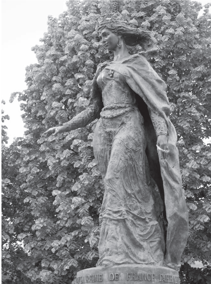
Figur 6. Anna som hon framställs av en nutida ukrainisk bildhuggare, Valentyn Znoba. Skulpturen rest i Senlis i Frankrike 2005.