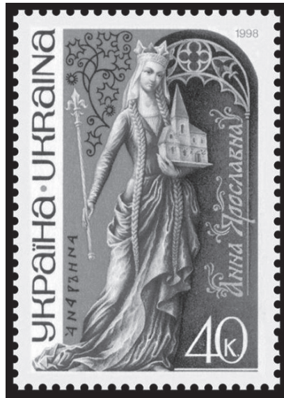
Figur 5. Anna på ett frimärke från Ukraina. Staven kröns av en fransk lilja och i famnen håller hon den kyrka i Senlis i Frankrike som förknippas med hennes namn och gärning.

personer. Att krönikornas förnäma kvinnor omnämns som fromma och dygdiga hör till mönstret och här är Anna Jaroslavna inget undantag. Gudsfruktan hade hon sig säkert lärt sig redan i barndomen i Kiev. Intressant är hur hon förfogade över de egna domäner som hon fått i morgongåva vid giftermålet med Henrik. Senlis några mil norr om Paris hörde till dessa. Där lät hon 1069 grunda ett kloster. Området gränsade för övrigt mot andre marken Raouls domän Crépy. På platsen fanns redan en kyrka, vigd åt S:t Vincent. Den var förfallen men hon lät restaurera den för sin far Jaroslavs och förste make Henriks själars skull. Klosterväsendet där gjorde visserligen franska revolutionen slut på men kort därefter återuppstod