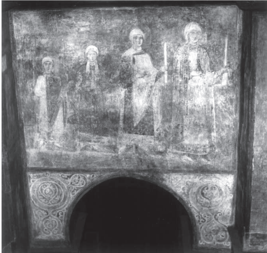
Figur 2. Fyra av Jaroslavs och Ingegerds barn i Sofiakatedralen i Kiev. Anna kan vara den första eller andra personen från vänster. De nästan 1000 år gamla freskerna är svårt skadade och många gånger restaurerade. Hela storfurstefamiljen var ursprungligen avbildad, men detta är det bäst bevarade väggpartiet.