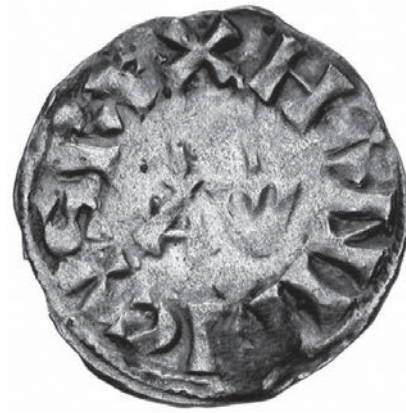
Figur 3. Mynt slaget för Annas gemål, Henrik I, i Paris. Inskription HANIRICVS REX. I mittfältet hängande alfa och omega (s. k. pendilia), en Kristusymbol.

Som en parallell till Ingegerdsringen från Sigtuna förekommer i källorna en ring som eftervärlden förknipat med Anna Jaroslavna. Det omnämns nämligen att den dåvarande kungen Ludvig VI år 1137 donerade en ring med en ovanlig ädelsten, en brandgul, genomskinlig så kall-