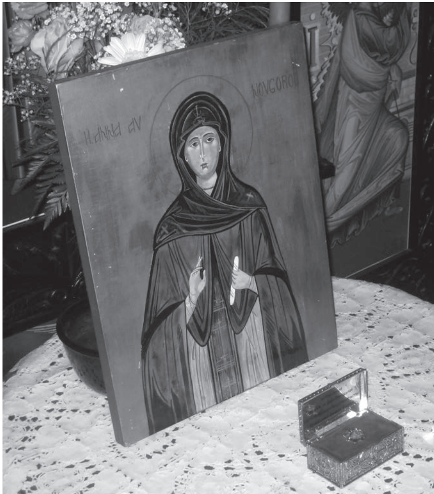
Figur 1. Ikon med Heliga Anna av Novgorod (dvs Ingegerd). I skrinet en relik, överlämnad från Moskva till en svensk ortodox församling 2009.

hämtades då upp ur det förflutna och laddades med nytt innehåll.