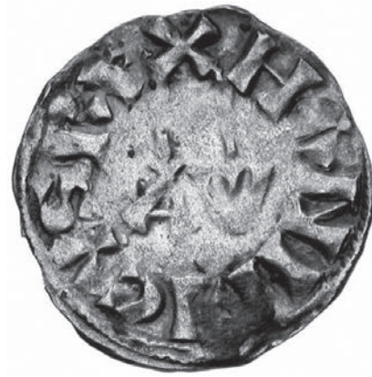
Figur 3. Mynt slaget för Annas gemål, Henrik I, i Paris. Inskription HANIRICVS REX. I mittfältet hängande alfa och omega (s. k. pendilia), en Kristussymbol.

Som en parallell till Ingegerdsringen från Sigtuna förekommer i källorna en ring som eftervärlden förknipat med Anna Jaroslavna. Det omnämns nämligen att den dåvarande kungen Ludvig VI år 1137 donerade en ring med en ovanlig ädelsten, en brandgul, genomskinlig så kall-