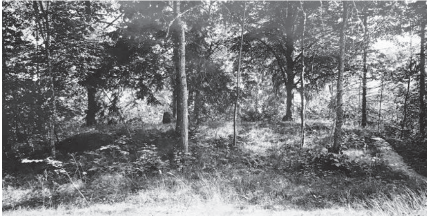
Figur 3. "Signhilds kulle", fornlämning 39, före skogsröjning. Stenstolen något till vänster om bildens mitt. Foto Harald Faith-Ell 1926 (ATA).

Tingshögen i Gamla Uppsala och Tynwald Hill på Isle of Man stannade utgrävaren för att det handlade om en tingshög (Sjösvärd 1991). (Figur 4.)