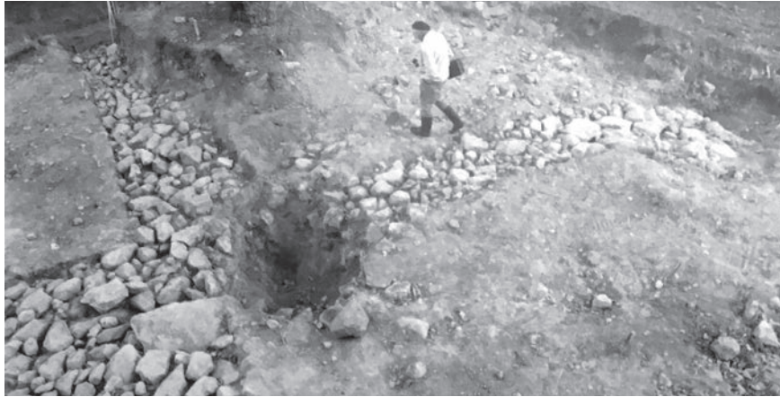
Figur 4. "Signhilds kulle" fornlämning 39, under utgrävning med den flata stenpackningen framrensad i schakten. I centrum en sentida hundgrav. Foto Lars Sjöswärd 1985 (ATA).

nu när det går att föreställa sig att de faktiskt kan ha funnits. En gemensam nämnare är att de på något sätt varit fysiskt avgränsade från omgivningen (heligt – profant), men därutöver kan stor variation väntas (jfr Andrén 2002; Jörgensen 2014).