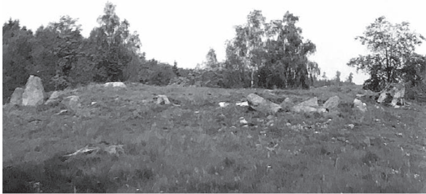
Figur 2. Den kvadratiske stensättningen, fornlämning 50, sedd från sidan före undersökningen. Foto David Damell 1988 (ATA).

varit en vishusbod, en så kallad fatbur.