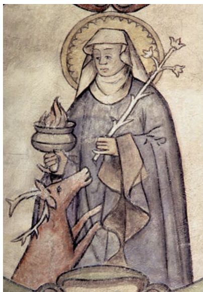
Figur 2. Katarina av Vadstena. Söderala kyrka, Hälsingland. 1500-talets första fjärdedel.

Den tredje och sista gruppen har en rak, ofta låg, överdel och skaft. Exempel finns i Gökhemms kyrka i Västergötland i Enångers kyrka i Hälsingland och i korportalen i Burs på Gotland (se fig. 3 och 4).