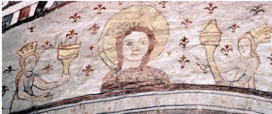
Figur 3 (övre bilden). Visa jungfrur i korportalen i Burs kyrka, Gotland. Foto Alfred Edle 1941. Kulturmiljöbild