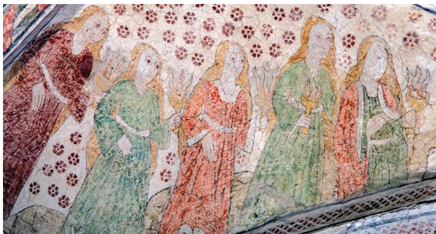
Figur 1. Hargs kyrka, Uppland. Målningen är, enligt en nu försvunnen inskrift, utförd 1514.

delen av 1400-talet och början av 1500-talet.