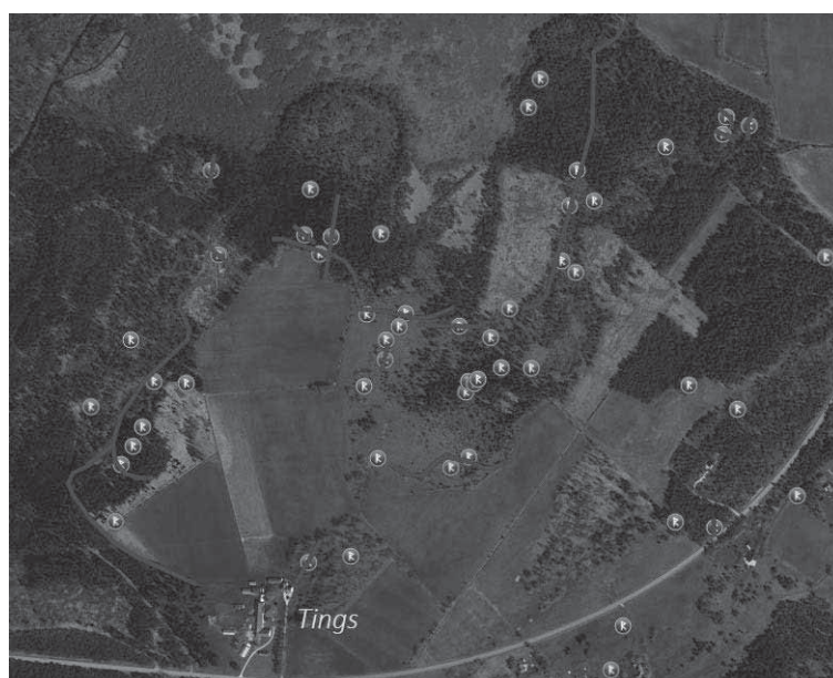
Bild 6b. Skattdokumentens Tingzgärdet och Tingzhagen låg söder om Bäl kyrka men ägdes i sin helhet av gården Gute. Peder Gute var tingsdomare i Bäl ting under åren fram till domstolsreformen 1618, vilket kan vara en anledning till att marken ägdes av just Gute. Ett större gravfält har varit beläget på grusåsen på ömse sidor om kyrkan men är till stor del borta idag. Enligt ortnamnsforskaren Ingemar Olsson har Bäl fått sitt namn av grusåsen, på vars sydsluttning kyrkan ligger. Kartan är hämtad ur Östergren 2018.

Bild 6c. Gården Tings i Kräklingbo ligger på gränsen till Ala socken. Namnet bör innebära att gården varit en del av tingsorganisationen. Gårdens inägomark är omgiven av ett omfattande stensträngssystem och i dess östra utkant finns fortfarande två grupper med sammanlagt åtta husgrunder från äldre järnålder. Kartan är hämtad ur Östergren 2018.