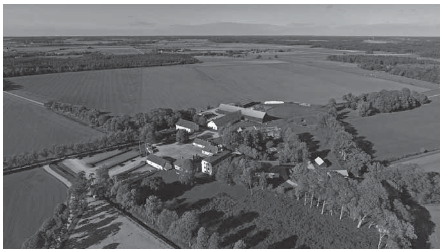
Figur 1. Gutnaltingets samlingsplats har sannolikt legat i den så kallade Guldäkern på höjdsträckningen norr om Roma kungsgård och klosterruinen. I bakgrunden den uppodlade före detta insjön Roma myr.