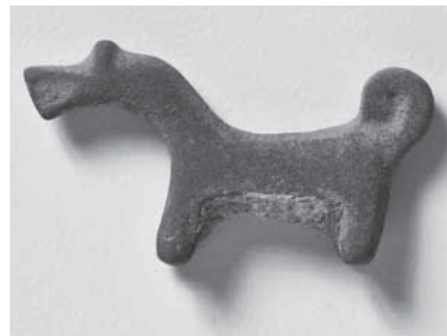
Figur 5a och b. Två djurformade viktlot som saknar paralleller på Gotland men som förekommer i Polen, Baltikum och Finland. Viktloten är 2–3 cm stora.

samlingsplats redan under äldre järnålder. Några ytterligare belägg för detta finns emellertid inte. Enligt numismatikern Lennart Lind kom denarerna till Sverige först på 300-talet (Lind 2018, s. 14).