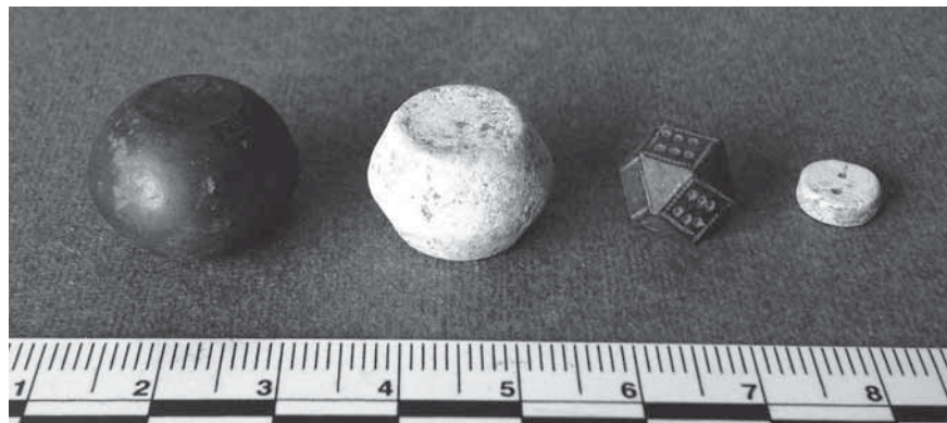
Figur 3. Olika typer av viktloд från Guldåkern. Vanligast är kubo-oktaeder, nummer tre på bilden. De är främst tillverkade av gedigen kopparlegering men förekommer även med en kärna av järn. Näst största gruppen är sfäriska viktloд av järn med skal av koppar, nummer ett på bilden.

Anmärkningsvärt är det låga antalet engelska och i viss mån skandinaviska mynt. Endast två engelska, ett danskt och ett skandinaviskt mynt har påträffats, samtliga små fragment. Under perioden 1000–1050 borde fler engelska mynt ha avsatts på platsen, eftersom de är rikligt förekommande i skattfynd från samma tid. Samtidigt visar andra mynt