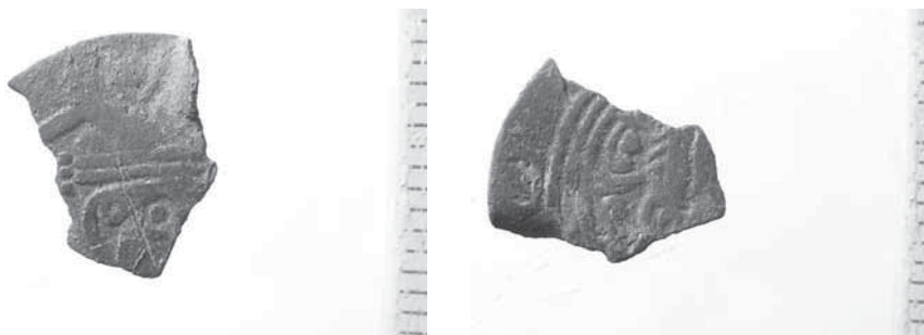
Figur 4a och b. Mynt präglat i Tabaristan cirka 780. Tabaristan låg i norra delen av nuvarande Iran och söder om Kaspiska havet.

att fyndmaterialet i både Guldåkern och Kräklinge Tingsäng är speciellt. Bland annat har ett ovanligt tidigt och ett ovanligt sent tyskt mynt hittats i vardera området (Jonsson 2017, s. 25–34). En speciell fyndgrupp från Guldåkern är dessutom sex tidiga arabiska mynt, så kallade arab-sassanider, som ligger nära varandra i tid. Mynten har präglats i Tabaristan på 770- och 780-talet. I skattfynden från Gotland, som tillsammans innehåller 180 000 mynt, finns sammanlagt endast fem mynt av samma typ, alltså färre än de som har hittats i Guldåkern (bortsett från Spillingsskattens 10 kända ex). Mynten från Tabaristan är vanligast i skattfynd från första hälften av 800-talet, vilket bör innebära att de sex silvermynten från Guldåkern har avsatts på platsen under motsvarande period (Kovalev 2015, s. 81).