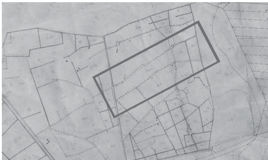
Figur 2b. Snett genom fornlämningen RAÄ Roma 85 kan två i det närmaste parallella linjer skönjas i både äldre och nyare kartor. Denna är från 1773. Bearbetning: Ny Björn Gustafsson.