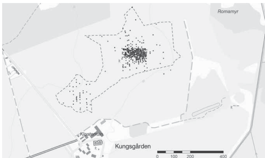
Figur 2a. Spridningen av vikingatida mynt och viktlojd i Guldäkern norr om Roma kungsgård. Ljuslila punkter är mynt och mörkblå viktlojd. Karta: Amanda Karn och Ny Björn Gustafsson.

Undersökningarna har förstärkt bilden av fornlämning RAÄ 85 men har också avslöjat en omfattande vikingatida verksamhet inom en sträcka av en dryg kilometer längs den forna insjöns strand öster om Kungsgården, bland annat inom den numera uppodlade Kräklinge Tingsängen. I dess norra del har någon form av gårdsbebyggelse varit belägen, både under äldre och yngre järnålder (RAÄ Roma 84:1/L1976:9608). Bebyggelsen ser ut att ha övergivits eller flyttats runt 1100.