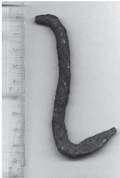
Figur 7. Under galgen hittades en krok som av utformningen att döma har suttit fastnaglad i trä. Kanske har den använts för att fästa upp avhuggna kroppsdelar, androm till varnagel?

De brända ben som hittats på avrättningsplatsen är sannolikt rester av några av de kvinnor som avrättats här. Kvinnor som dömdes till döden fick ofta det skärpta straffet att brännas, i de allra flesta fallen efter att de avrättats, åtminstone under 1600- och 1700-talen. När det gäller dödsstraff som tilldömts kvinnor på Gotland är brottet bakom domen ofta barnamord. År 1651 dömdes en Ursula till att avrättas. Hon skulle halshuggas och brännas på bål (Rötter, 1). En snarlik dom föll 1662 för Brita Pedersdotter, en piga från Lundebiers i Lummelunda