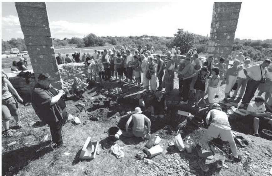
Figur 4. Intresset för undersökningen av den gamla avrättningsplatsen var stort.