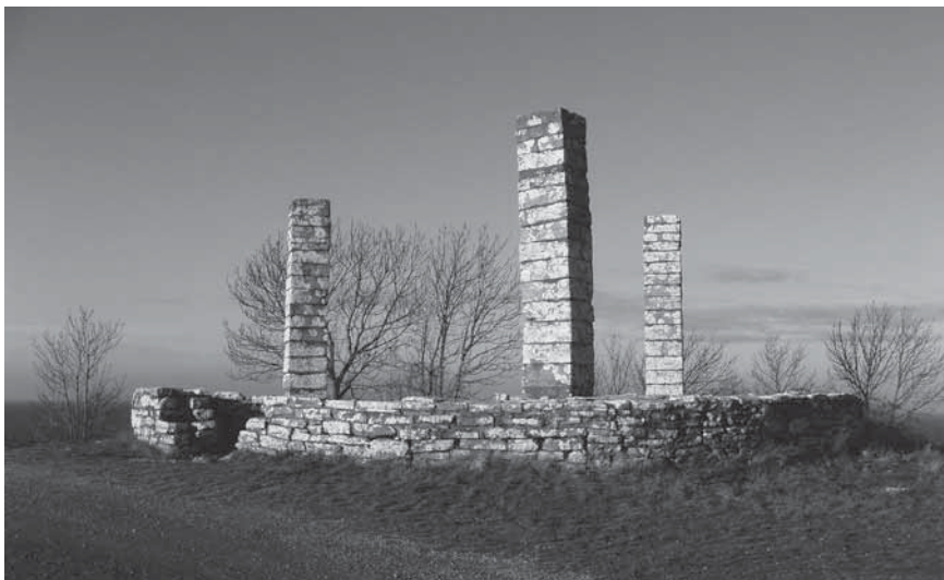
Figur 1. Galgen idag.

och Carl Gustaf Styf för förmodligen första och säkerligen sista gången” (Lundgren 2003, s. 23).