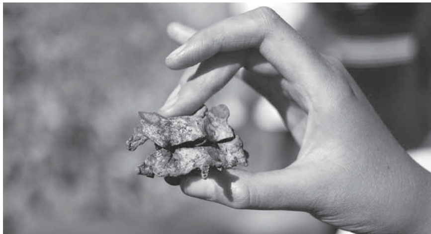
Figur 8. Personen som låg i den övre kistan hade fått huvudet och resten av kroppen åtskilda mellan den fjärde och femte halskotan.

Att galgen som anläggning bar på ett juridiskt budskap står klart. Kanske bar galgen under den senare medeltiden också med sig ett