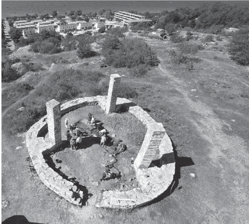
Figur 3. Galgen från ovan.