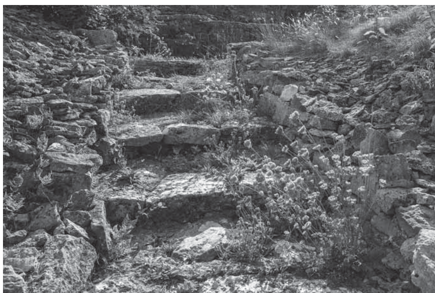
Figur 2. En stenlagd gång med trappsteg leder upp till minnesmärket.