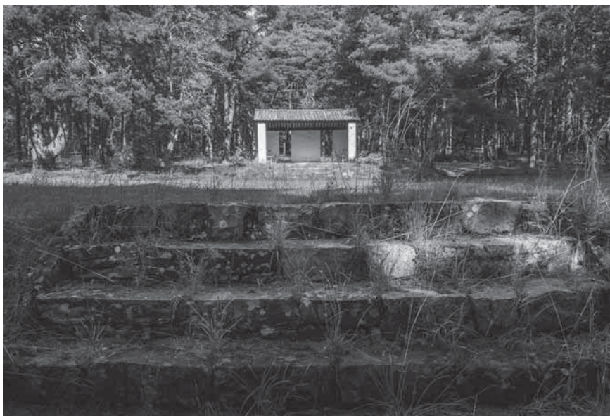
Figur 9. På platsen för Lager Lingen finns flera bevarade anläggningar skapade av de internerade, bland annat den scen där skådespel och musikunderhållning framfördes.

och österrikiska desertörer som tack till Sverige och till minne av sin interneringstid skapade ett tre meter högt monument i sten och betong med scener ur de internerades liv och med en stor staty av en internerad tysk som står på en brusten svastika (Johansson 2004).