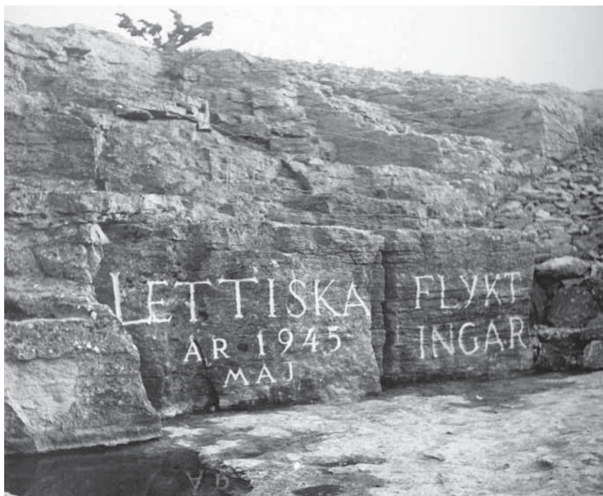
Figur 1. Den nyligen färdigställda ristningen med källan till vänster. På fotot anas flera taggträds- linjer.