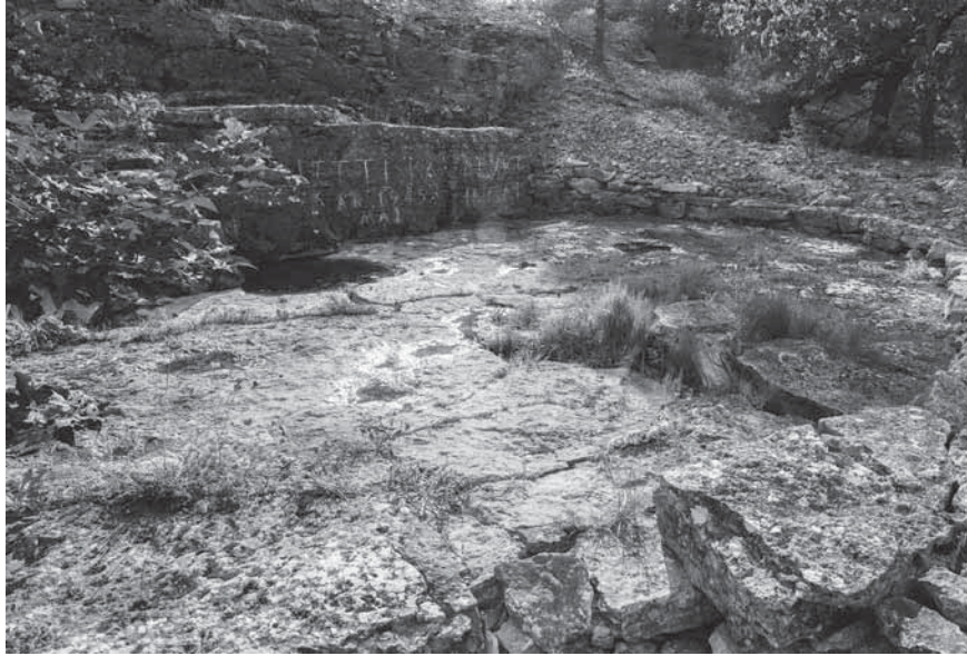
Figur 3. Flyktingkällan sedd från norr. Notera stubben efter pilträdet till höger.

grenar anses symbolisera sorg – men även återuppståndelse – och som därför haft en given plats på kyrkogårdar (Bengtsson & Bucht 1992; jfr Deetz 1977, s. 69–72). Vid den minnesstund som hölls på Flyktingkällan deklamerade en representant för Lettiska Akademiska Nationers Förbund tanken bakom detta gröna tillskott till minnesmärket: