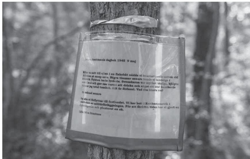
Figur 5. Nedanför flyktingkällan växer en ek, som kan ha planterats av flyktingarna 1945. Vid eken har fästs en avskrift av en av flyktingarnas dagbok.

Under andra världskrigets slut fanns det omkring 185 000 flyktingar, evakuerade och andra nyanlända utlänningar i Sverige. För att ta emot