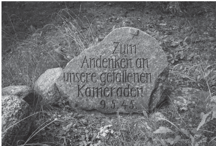
Figur 8. Minnesstenen i förläggningen Lager Lingen över de drygt 70 tyska soldater från Kurlandsarmén som dog under flykten till följd av beskjutning till sjöss.

Minnesstenen och sockeln i Lager Lingen är intressanta paralleller till Flyktingkällan, eftersom det rör sig om fasta monument, skapade för att uttrycka ett budskap men också för att inpränta ett minne i en plats. Sådana minnesmärken har sällan uppmärksammats inom forskningen om skyttegravskonst, men verkar vara en del av den materiella kultur som kan relateras till just lägerkontexter. Bland andra svenska exempel kan nämnas den så kallade ”Rysstenen” i Skinnskattebergs skogar, där ryska krigsfångar internerades i den slutna förläggningen Krampen under arbete med ett vägbygge såg till att rista in kommunistpartiets stjärna, en hammare och skära samt inskriptionen CCCP 1944 (Lihammer 2006). Ett annat fall finns i Vägershult i södra Småland, där tyska