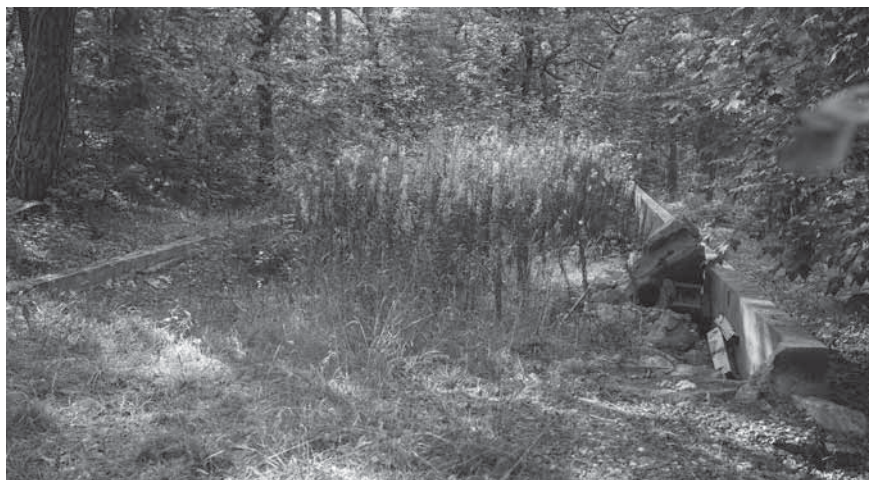
Figur 4. Grunden efter den större före detta militärbaracken.

70-årsdagen av de i mottagningslägret förlagda flyktingarnas ankomst till ön. Eftersom tillståndet dröjde fick dock planteringen, som denna gång bevittnades av 20-talet personer, istället ske senare samma sommar (Strautmåne 2015).