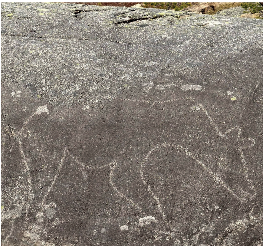
Figur 4. Bjørn avbildet på en slipt helleristning og ut fra høyde over havet er denne type bergkunst anslått til å være opptil 10 000 år gammel.

rein og elg slik som reinen på den nordligste hellemalingslokaliteten i Skandinavia, Lafjord i Nordkapp kommune (Helberg 2016, s. 99).