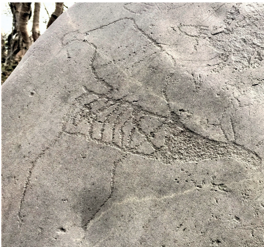
Figur 6. En bjørn som angriper en rein? Bjørnehodet er plassert i reinens skulderparti. Over bjørnen er det to bjørnespor med klør. Motivet kan også tolkes som en symbiose mellom rein og bjørn der begge dyrene blir oppfattet som like viktig for menneskene. Helleristningen er nylig funnet på Isnestofen i Alta kommune, datert til 5000–4000 BCE.