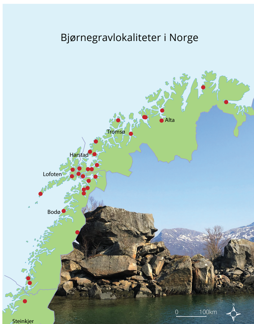
Figur 1. Utbredelse av bjørnegraver i Norge. Et typisk landskapstrekk ved gravene langs kysten er at bjørnebeinene ligger under store steinblokker. Bjørnegrav i Nevelsfjord i Bodø kommune datert til 11-1200 tallet. Foto: Ingrid Sommerseth, Grafikk: Grafiske tjenester, Norges arktiske universitet UiT.

tradisjonene og de rituelle handlingene. De tidligste kildene finner vi i de mange misjonsberetningene fra 1600 og 1700-tallet (Niurenius 1645; Rheen 1671; Schefferus 1673; Dass 1739; Fjellström 1755; Leem 1767; Friis 1871). Utover