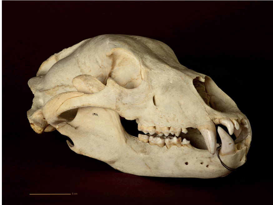
Figur 2. Bjørneskalle fra Lekangen på Senja sendt inn til Norges arktiske museum i 1911, funnet i ei ur og datert til tiden mellom 1700–1900-tallet.

sammen og mye forsvant eller kastet før arkeologene ble varslet. I museets funnkatalog fra arkivet kommer blir det ofte nevnt at bjørnebein og hodeskaller hadde blitt oppbevart i lang tid lokalt i bygda før de ble samlet og sendt inn til museet. Allerede da var funnkonteksten borte og kunne derfor ikke arkeologisk undersøkes. Det er kun lokalitetene; Bunkholmen i Lyngen funnet i 1982, Hánoaivi i Øst-Finnmark funnet i 1985 og Røykenes i Lavangen funnet i 1988 som ble arkeologisk undersøkt da de ble funnet. I museets magasin har vi i dag bevart 24 bjørneskaller som kommer fra hele Nord-Norge, noen få er hele mens de fleste er fragmenterte, og de relateres til 18 av de 30 bjørnegrav-