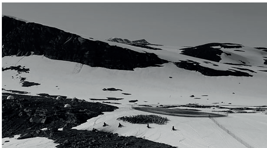
Figur 4. Insamling av ren inför kalvmärkning på snölegor med gärde och ledgärde synligt. Bilden är från Tjæhkeren Sijte.

sommardagar lämnar de ogärna snön och blir lättare att hantera. Andra tillfällen då snölegor kommer i bruk är exempelvis i samband med kalvmärkning och renskiljning (se fig. 4). Märkningen på snö innebär att renen har lättare att hålla sig sval och klarar värmen bättre. När snö inte finns att tillgå förläggs ofta kalvmärkningen till nattetid då det är svalare på dygnet.