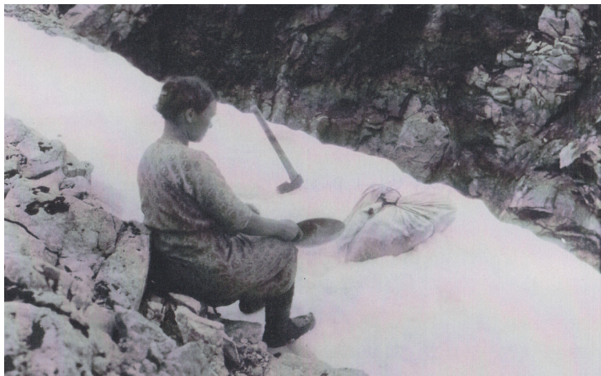
Figur 6. Mat som ska bevaras i snölega på sommaren.