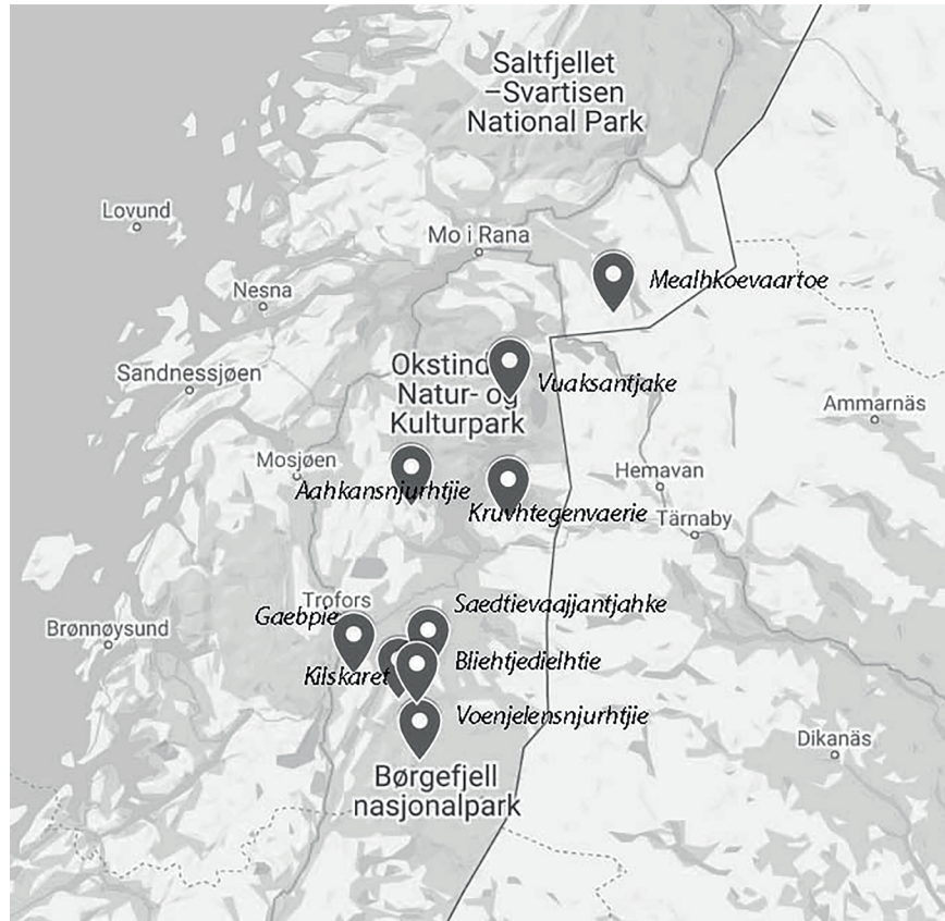
Figur 1. Karta över området med markerade och namngivna områden som primärt ingick i projektet eller omnämns i texten, karta från google maps.