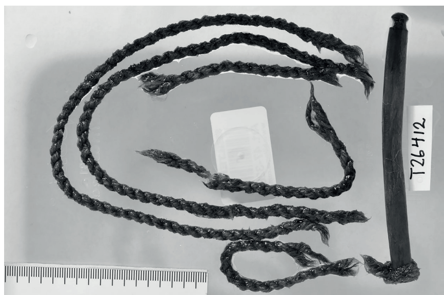
Figur 3. Fynd av en skråavva vid Saedtievaajantjahke.

projekt har även ett litet område invid glaciärerna i området kring Vuaksantjake – Okstindan besökts (se fig. 1). Här finns ett stort område med många sammanhängande större- och mindre glaciärer i exponering mot söder, öster och sydost på mellan 950 – och 1500 m.ö.h. De högsta fjälltopparna bryter genom själva glaciärområdet och når över 1800 meter. En väg in till området går genom Bissiedurrie – Bessedørdalen, eller mer korrekt översatt från samiska ”Heligadalen”. Här ligger gammal is exponerad året runt och en hel del är i söderläge, enligt Sten Renberg traditionsbärare och tidigare renskötare i området, har hela det södra glaciärområdet ner mot dalgången minskat betydligt sedan 1930-talet. Då gick området med is mycket längre ner i dalgången. Inget material från glaciärerna här har tagits in för analys genom projek-