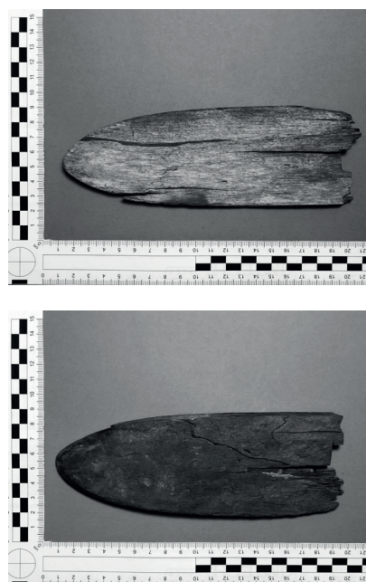
Figur 3a och 3b. Fotografi av Loktačohkka-skidan, a. framsidan, b. baksidan.

Skidfragmentet kommer mest troligen från den högra skidans framspets med tanke på det tydliga slitaget samt avsaknaden av skåra. Det går inte att avgöra skidans ursprungliga längd, däremot kan vi med stor sannolikhet, uppskatta skidans maximala bredd till cirka 70 millimeter (Fig. 3a–b). Med tanke på tidigare påträffade/upphittade