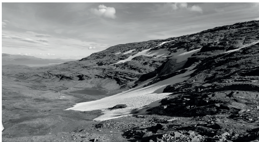
Figur 2. Fotografi av Loktačohkka-glaciären mot öster, taget den 9 augusti 2018 (Foto: Markus Fjellström).