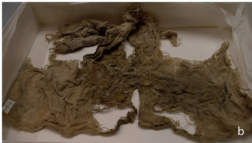
Figur 5. Textilsvepningarna som använts för att linda fostren. Fläckarna på tygen indikerar var fostren var placerade. (a) Insidan av svepningen från Gällared (14,7 x 8,5 centimeter). (b) Insidan av svepningen från Bringetofta (cirka 30 x 55 centimeter).