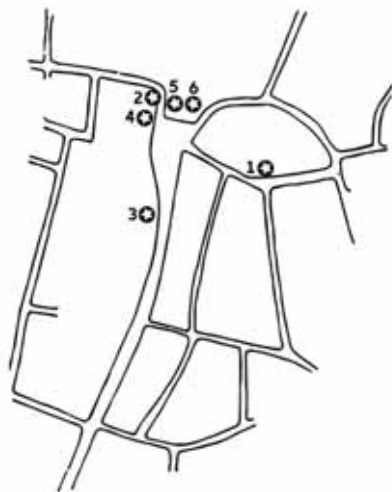
Figur 5. Platser i Lund där det påträffats föremål med anknytning till myntning. Kartan visar stadens tidiga gatunät. 1. Blyplåten med myntstampsavtrycket från Sven Estridsens tid, 2. Markvikt med avtryck av myntstämpel från Valdemar I:s tid, 3. Myntstamp troligen från Erik Plogpenning's tid, 4. Myntstamp från Kristoffer I:s tid, 5. Myntstamp med vid datering; slutet av 1200-talet fram till efter 1300-talets mitt, 6. Myntstamp troligen från Magnus Erikssons tid. Om dateringar se vidare Moesgaard 2015. Karta från Cinthio 1999.

Anders Andrén (1980, s. 72) fortsatte att utveckla diskussionen om myntverkets placering. Enligt Andrén var den nära kopplingen mellan kungsgård och myntverk, som Blomqvist och Mårtensson hävdade, förmodligen riktig. Utifrån den placering som Holmberg fört fram för kungsgården – att den låg precis väster om domkyrkan närmast motsvarande dagens Kyrkogata – hävdar Andrén att myntverket bör ha funnits i någon av byggnaderna inom detta kungsgårdsområde.