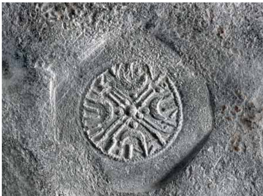
Figur 3. Detalj från myntstampsavtrycket. På avtrycket syns ett kors och textraden FATI:| LYNTI:|.

Från dagens svenska område är stampavtryck från 900- och 1000-talet sällsynta. Förutom från Lund föreligger endast fynd från kv Urmakaren i Sigtuna. Vid undersökningar i detta kvarter år 1990 påträffade arkeologer spåren av en byggnad. I ena hörnet, på golvet nära en ässja, framkom flera kilo degelfragment som härrörde från tillverkning av vikter och kontroll av silver, två blybitar med avtryck av myntstamps samt en klippt bit av ett färdigpräglad Sigtunamynt. Dessutom hittade arkeologerna spår av andra exklusiva hantverk i form av silverklumpar och guldtrådar. Avtrycken på en av blybitarna kunde härledas till stampprovningar från en utmyntning som ägde rum ca 1015–1020. Byggnaden med spåren av mynt- och viktillverkning har