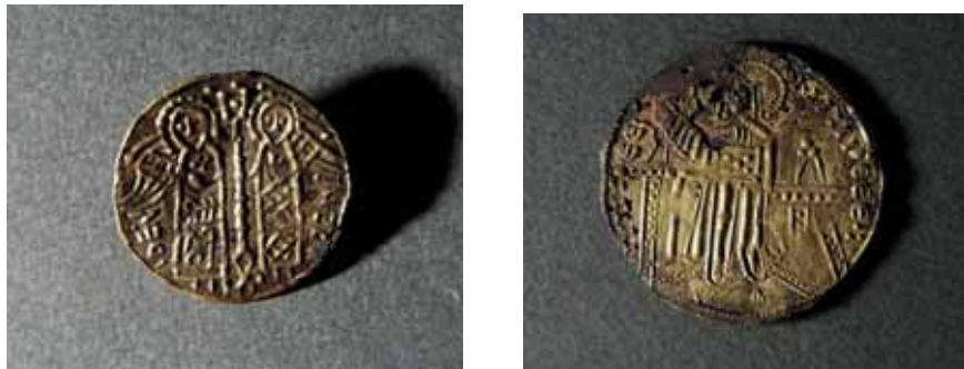
Figur 6 a, b. Två små broscher påträffade i Lund som återger myntbilder. Diameter för den mindre broschen är 26 mm. KM 53.436: 621 och 59. 126: 408. Foto: Kulturen, Lund. 2015.