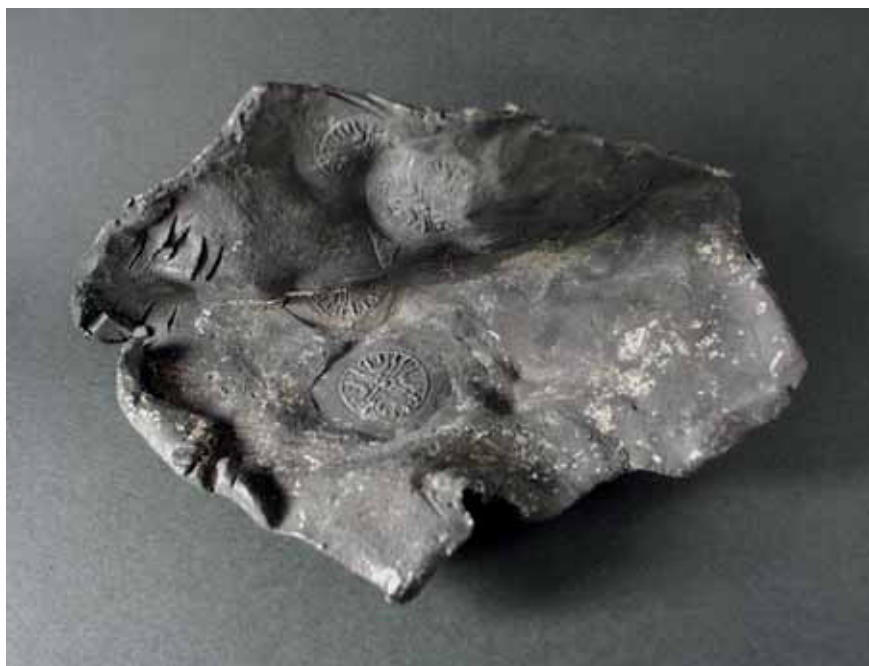
Figur 1. Blyplåten med myntstampsavtryck från Sven Estridsens sista tid som dansk kung. Avtrycket representerar typ 32a enligt den indelning av runmynt som gjorts av P. Hauberg (1900).

Fyndet ger upphov till en rad frågor. Varför präglades mynt med runskrift under Sven Estridsens senare år som kung? Vilka tillverkade mynt under andra halvan av 1000-talet? Var i Lund ägde tillverkningen rum under denna period? I artikeln undersöker jag hur kunskapsläget och svaren har förändrats över tid samt sammanfattar var forskningen står idag avseende dessa frågor. Medan Sigtunamyntningen ägnats mycket forskarmöda under de senaste decennierna har den tidiga utmyntningen i Lund av olika anledningar berörts i betydligt mindre omfattning. Min förhoppning är att denna översikt kan sporra till vidare diskussion och nya arkeologiska och numismatiska ansatser.