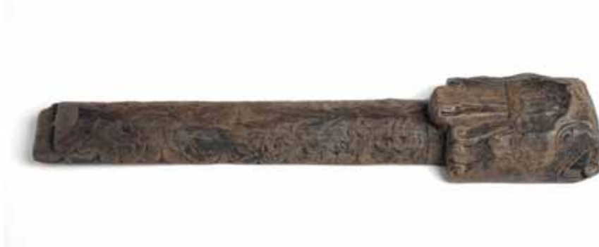
Figur 4. Det vackra pennskrinlock i Winchesterstil som påträffades strax söder om nuvarande Kattesund.