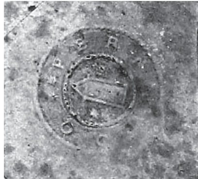
Figur 7. Österfärnebos sockensigill i papper och vax i mantalslängd från 1633. Äldsta belägg för användandet. Österfärnebos kyrkoarkiv, Landsarkivet, Härnösand.

sten Wittinghs omnämnande av Sankta Barbara (1971; 2011). En- ligt muntlig uppgift av Bengt Ing- mar Kihlström (i Andersson 2011) var också denne framstående kän- nare av medeltida kyrkoliv benägen att se Barbara som Österfärnebos patronus. Också i kyrkans infor- mationsbroschyr, utgiven av ärke- stiftet, framförs denna uppfattning