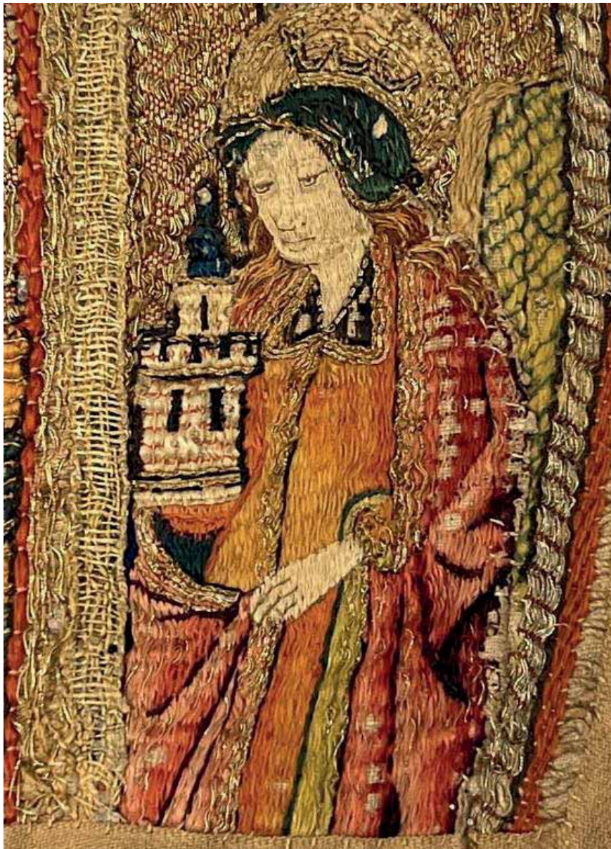
Figur 5. Mässhake från Österfärnebo (detalj). Här avbildas Sankta Barbara dyrbart klädd i rött, grönt och guld. Hon bär en krönt huvudbonad med bakgrund av en gloria. Hon sveper mantelfällden runt sitt attribut, tornet, som är krenelerat och försett med tre fönster. SHM inv. nr 5302.