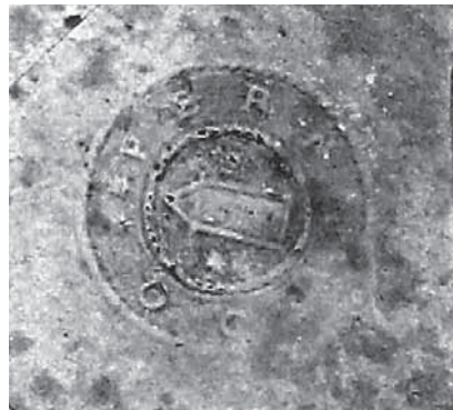
Figur 7. Österfärnebos sockensigill i papper och vax i mantalslängd från 1633. Äldsta belägg för användandet. Österfärnebos kyrkoarkiv, Landsarkivet, Härnösand.