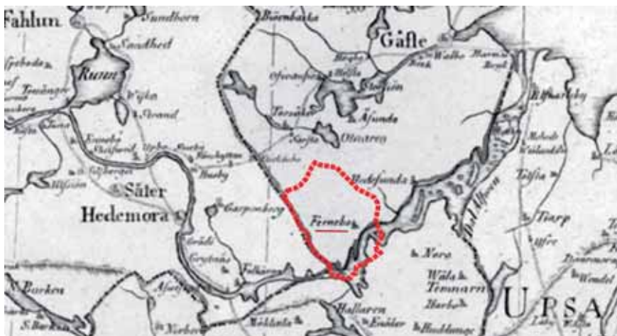
Figur 1. Österfärnebo ligger vid nedre Dalälven och i sydligaste Gästrikland. Närmaste grannsocknar är i norr Torsåker och Årsunda, i öster Hedesunda, i söder Nora och i väster By. Bildunderlaget är en landskapskarta från ca 1795.

batter i sockenstämman togs 1796 beslut om en ny kyrka. Men kort därefter drabbades bygden av flera missväxtår och därpå utbröt ryska kriget. Bygget drog ut på tiden. Det var i stort sett klart 1822 men invigningen kunde äga rum först 1827. Den medeltida kyrkan fick stå kvar strax intill den nya till 1830, då den revs.