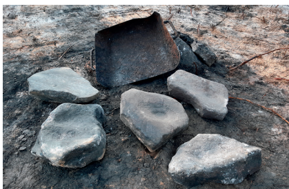
Bild 1. Fem av de bokningsstenar som påträffades vid undersökningen av Dammens hytta tillsammans med ett fyllfat som använts för att bära kol eller järnmalm.

Trots att verksamheten pågått under så pass lång tid var spåren på platsen förvånansvärt få. Endast rester av ett par enkla skjul för förvaring av järnmalm hittades. Fyndmaterialet var mycket sparsamt och bestod av enstaka keramikskärvor, kritpipor och djurben. Däremot hittades en stor mängd så kallade bokningsstenar (bild 1). Själva masugnen förstördes helt då järnvägen drogs fram på 1870-talet och en kättingsmedja och en såg byggdes på platsen. Aktiviteterna vid hyttan företogs sannolikt bara i perioder när det fanns tillräckligt med vatten för att driva bälgarna vilket gjort att man inte varit i behov av några mer permanenta byggnader, förutom masugnen.