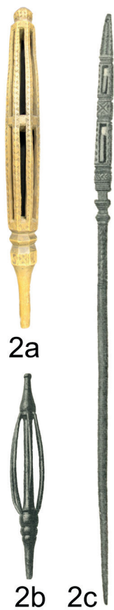
Figur 2a: Torock (Linhuvud) med lösa kulor inuti, Vänersborgs museum: VM04369. Figur 2b: Linfäste från Väderstad socken, Östergötland, avbildad i Jirlow (1924) sidan 157. Figur 2c: Linkäpp från Eda socken i Värmland, avbildad i Jirlow(1924) sidan 158.

från 2000 år f.v.t. fram till modern tid kan vi se att spinnkäppar används på en rad olika sätt. Det finns långa och korta som bärs i bälte, på framsidan eller baksidan av kroppen. Det finns korta som kläms fast i armhålan. Det finns också många bilder av spinnerskor som sitter ner och spinner, med spinnkäppen fastklämd mellan knäna, fäst vid en bänk, eller stående i ett stativ med korsfot. I de fallen är tyngden snarare en fördel då man kan dra fibern utan att den välter.