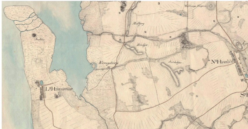
Figur 7. Snickebjør mellom Foteviken og Norra Haslöv. Nærmere Foteviken ligger Kongstorp (Stora Hammar 22:1), en gårdstomt og gård som skal ha blitt lagt øde på 1300- og 1400-tallet. https://sok.riksarkivet.se/Home!/?postid=Arkis+30c3c29b-cbdb-479a-b715-9102997bd90&flik=1&s=Balder Utdrag fra originalkart hentet fra Riksarkivet/Krigsarkivet och samlingen Topografiska kårens kartor, Skånska rekognoceringskartan 1812. Gjenbruk godkjent av Riksarkivet.