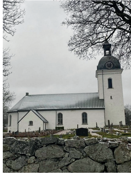
Fig. 1: Åseda kyrka, bild tagen från norr. Foto: Elias Engdahl, december 2022.

Liepe och Ullén har genom detta arbete bidragit med relevans och förståelse av de arkeologiska fynd som har gjorts i Åseda kyrka. Där- emot har föremålen inte diskuterats i någon vidare grad mer än deras datering. Syftet med denna artikel är därför att undersöka och tolka de bemålade bitarna av fönsterglas, mynten och en specifik murad konstruktion under koret. Hur reflekterar dessa arkeologiska fynd Åseda socken under medeltiden? Bör dateringen av dessa föremål användas som en motpol för dateringen av sal-