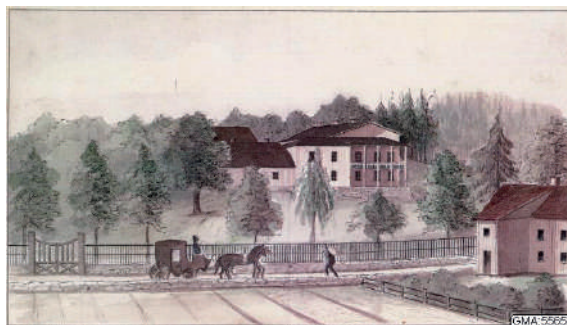
Figur 10. Johanneberg omkring 1850, sett nerifrån Södra vägen. Trädgården är bara skissartat redovisad, men intrycket är en lummig plats med uppvuxna träd, delvis dold för dem som passerade nedanför.