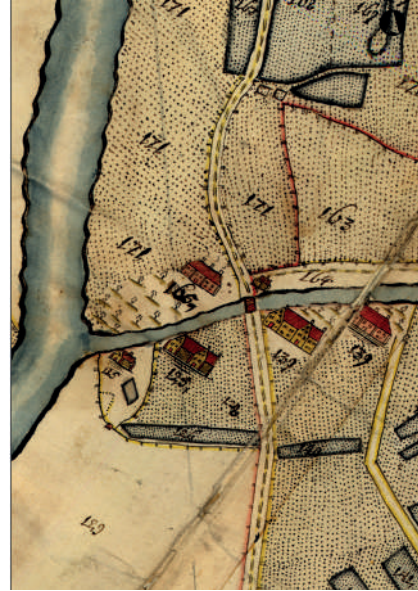
Figur 7. Marieholm (nr 165) på kartan 1696.

I samband med de arkeologiska undersökningarna av Nya Lödöse