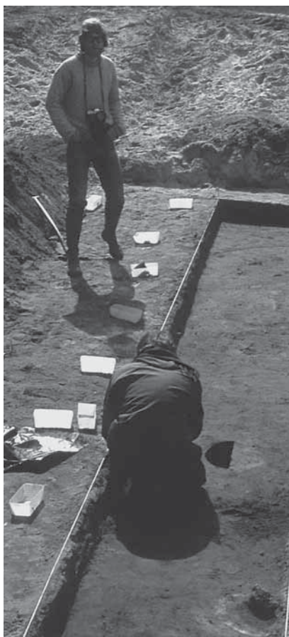
Figur 4: Fra en gravning i Falsterbo, mai 1976. Prøvesjakter, dokumentasjon av horisontal stratigrafi og funnnummer relatert til lag var rutiner på gang.

forsøk på å a) beskrive og begrunne et nytt teoretisk praksisbehov innen middelalderarkeologien, b) som en begrunnelse for hvorfor ønsket om å etablere en ny forskningspraksis vokste fram akkurat der og da, og endelig c) hva som påvirket utformingen av en slik ny praksis.