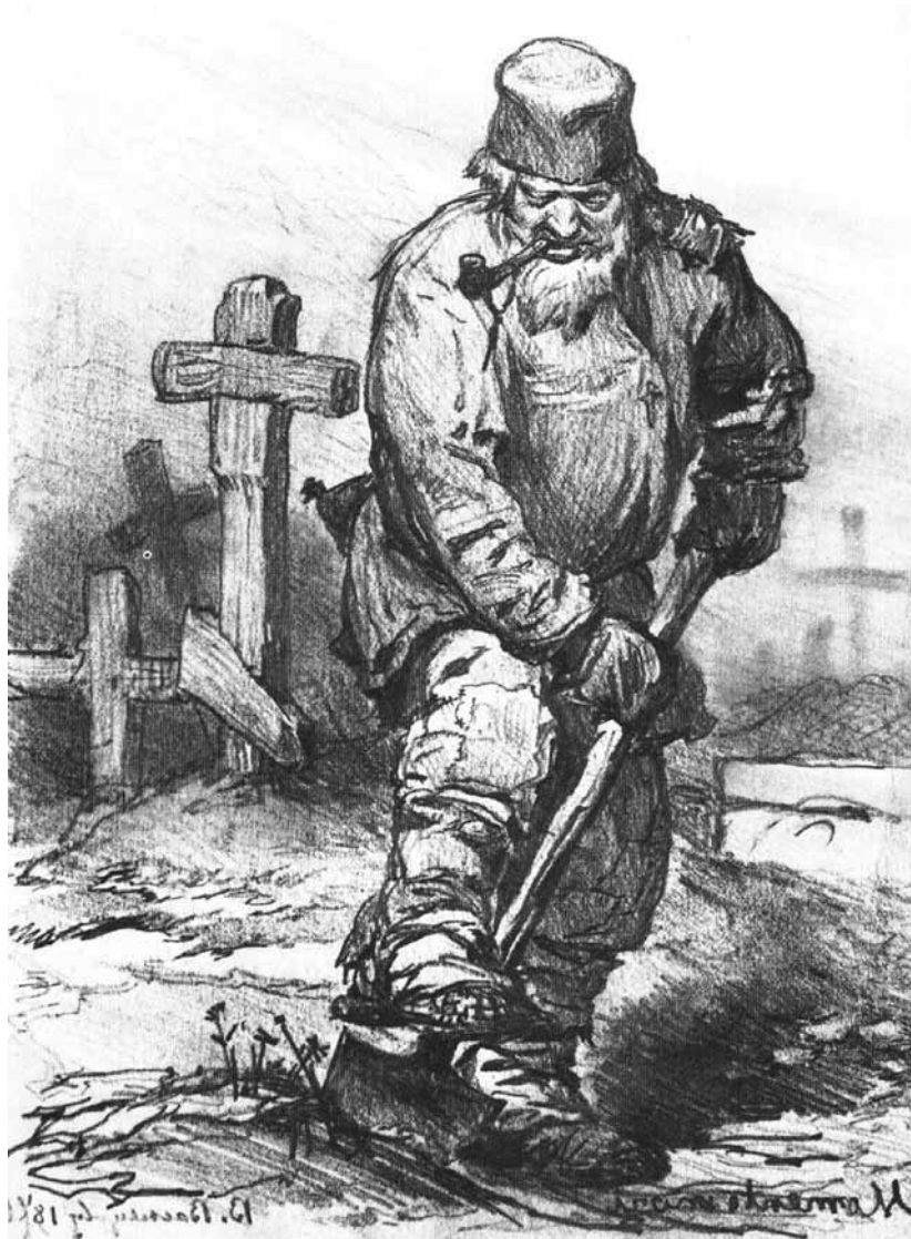
Figur 2. Hur grävdes graven och av vem/vilka? Målning från 1871 av Viktor Vasnetsov.