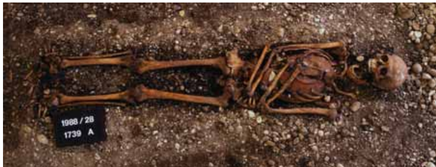
Figur 3. Bilden visar en grav från 1853 undersökt på Spitalfriedhof St. Johann i Basel. Den gravlagde mannen har en tallrik under bröstbenet och revbenen. Möjligen ett illustrativt exempel på hur förmultningsprocessen kan påverka placeringen av föremål i en grav. Åtminstone har författaren av denna artikel svårt att komma med andra alternativ.

Återfyllning av graven: Gravfyllningen är en relativt negligerad enhet vid undersökning av gravar, men den kan ha potentialen att vara mycket mer än bara just en enhet. När en gravnedgrävning har lokaliserats hamnar fokus lätt på att så snabbt och enkelt som möjligt ta sig ner till "graven", och man glömmar att även återfyllningen har varit en