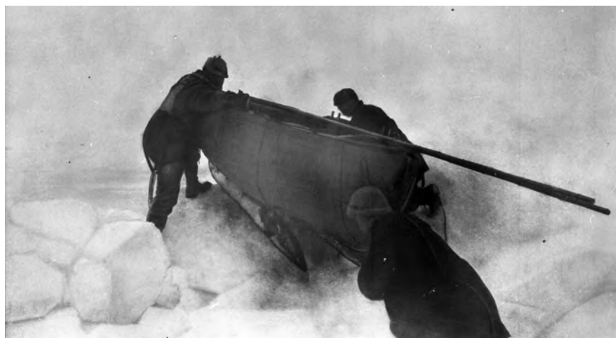
Figur 2. De tre människors slädvandring över den upptornade och sönderbrutna packisen blev krävande. Målet kom heller inte närmare eftersom isen drev åt motsatt håll.

Var då färden utsiktslös? Sedan expeditionen försvunnit fick de som varit skeptiska vatten på sin kvarn. Ballongernas epok var också snart förbi, de följdes som färdmedel av styrbara luftskepp och flygplan. Men drygt 100 år efter Andrée lyckades britten David Hempleman-Adams verkligen med bedriften att nå nordpolen med ballong. Hans farkost var fylld med helium och han höll sig också högt ovan molnen och slapp därmed de fuktproblem som Örnen råkade ut för. Hempleman-Adams styrde genom att reglera sin position i höjded efter var de gynnsammaste vindarna fanns. Han fick löpande instruktioner per radio och satellittelefon från väderexpertis. ”Marginalen mellan framgång och misslyckande är hårfin. Andrée skulle mycket väl ha kunnat lyckas om han bara haft en bråkdel av den meteorologiska information som jag hade tillgång