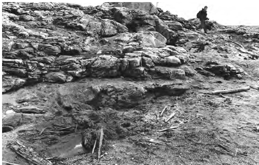
Figur 4. Expeditionens lägerplats på Vitön, sedd mot söder. Foto från augusti 1998 då platsen var snö- och isfri. Det fanns fullt med fragment av bambu, tyg och metall på marken.

Vid första tillfället, i augusti 1998, kunde Broadbent och medarbetare genomföra en dags, sex timmars, fältarbete på platsen, som