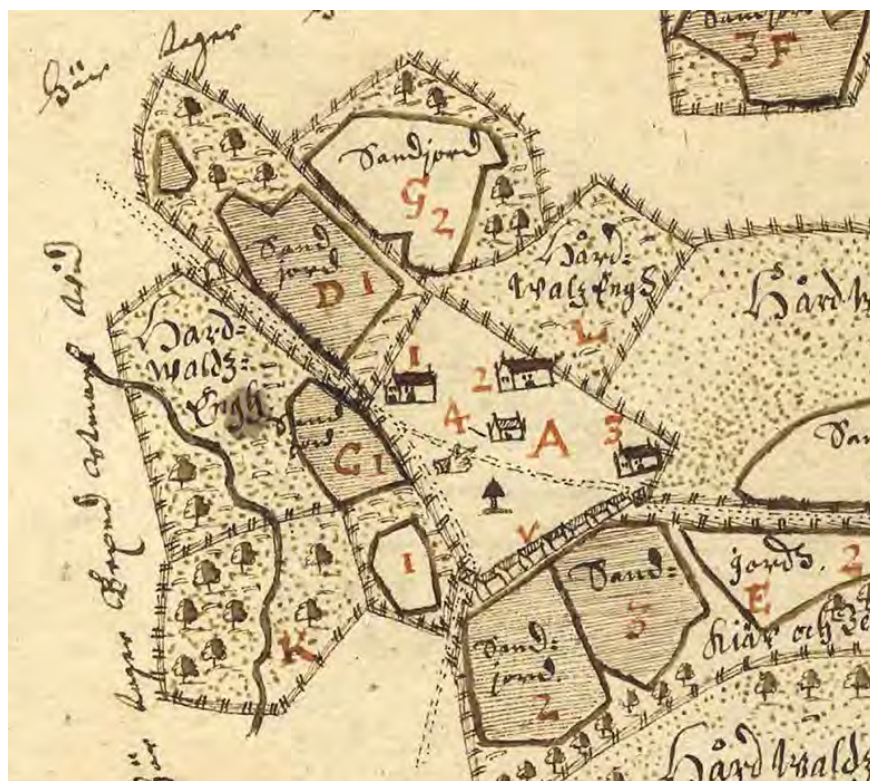
Figur 4. Utsnitt ur Geometrisk ägoavmätning över gården Torget 1645 som visar marknadsbodan (v) och tingsstuga (4). Johan Larsson Grot, Lantmäteristyrelsens arkiv E123-50:e4:6-7 26.

landa kyrkby där ett nytt tingshus byggdes. På 1560-talet fick Vetlanda också en gästgivaregård och år 1586 anges marknaden i Vetlanda vara en enskild marknad för Eksjöns borgare (Larsson 1995, s. 57).