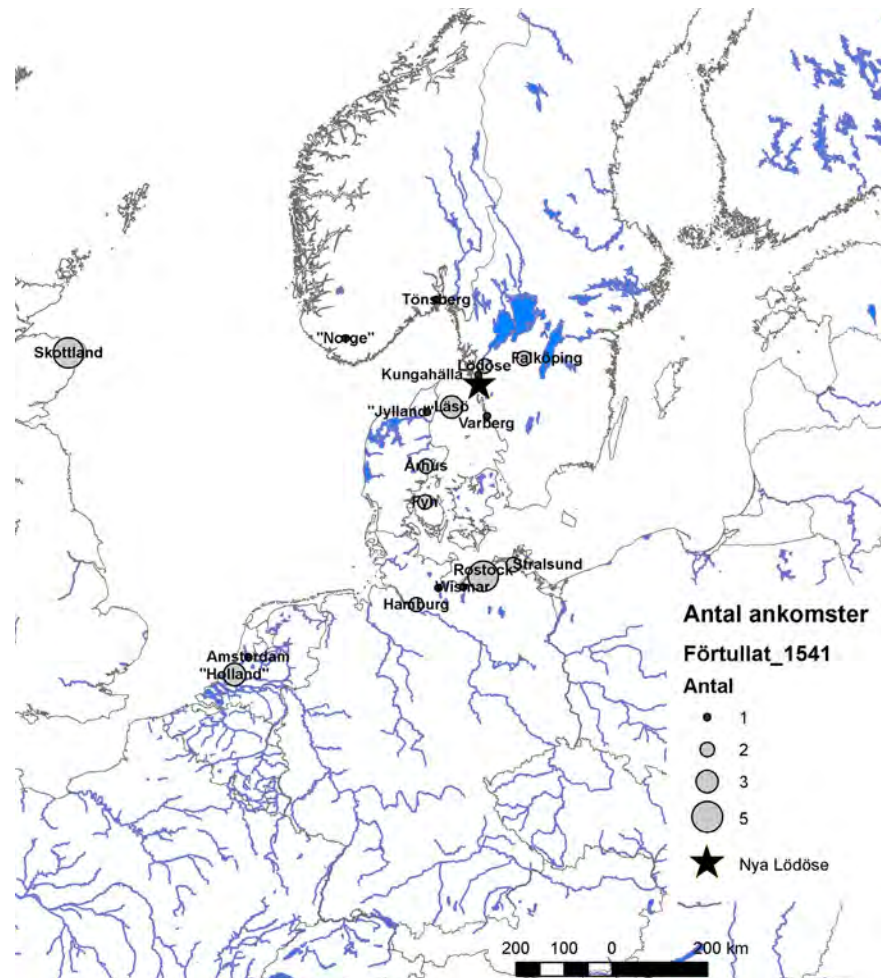
Figur 4. Kartan visar de orter som nämns i Nya Lödöses tullängd 1541 och antalet ankomster från respektive ort. Källa: Riksarkivet, Landskapshandlingar, Västergötlands handlingar, Nya Lödöse 1542.

tande privilegier här. En del av handeln mellan den svenska kronan och de holländska köpmännen gick denna väg, även om mycket fortfarande också fördes via Nya Lödöse. Karl IX:s Göteborg brändes under Kalmarkriget och återuppbyggdes aldrig (Scander 1975).