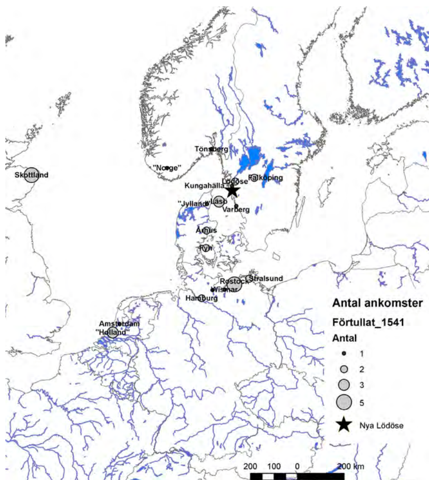
Figur 4. Kartan visar de orter som nämns i Nya Lödöses tullängd 1541 och antalet ankomster från respektive ort.

tande privilegier här. En del av handeln mellan den svenska kronan och de holländska köpmännen gick denna väg, även om mycket fortfarande också fördes via Nya Lödöse. Karl IX:s Göteborg brändes under Kalmarkriget och återuppbyggdes aldrig (Scander 1975).