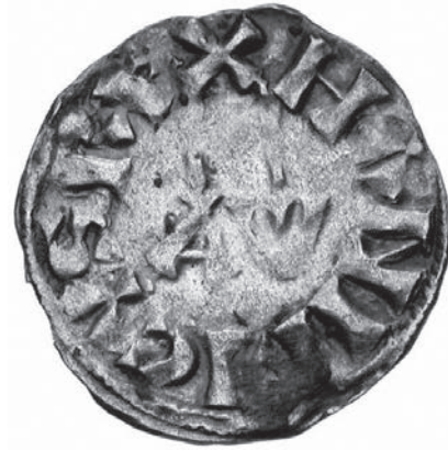
Figur 3. Mynt slaget för Annas gemål, Henrik I, i Paris. Inskription HANIRICVS REX. I mittfältet hängande alfa och omega (s. k. pendilia), en Kristusymbol. (CC0)

Som en parallell till Ingegerdsringen från Sigtuna förekommer i källorna en ring som eftervärlden förknipat med Anna Jaroslavna. Det omnämns nämligen att den dåvarande kungen Ludvig VI år 1137 donerade en ring med en ovanlig ädelsten, en brandgul, genomskinlig så kall-