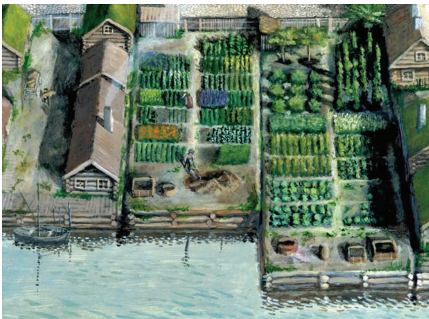
Figur 5. Exempel på konstruktion med timrade kistor som fylls upp med olika typer av material och sedan nyttjas för olika ändamål (Illustration Jens Heimdahl 2014).

Det kanske är den här typen av strandnära byggnationer vi främst förknippar med medeltida hamnstäder och urbaniseringen. Ett gytter med träkonstruktioner som förbättras och byggs ut succesivt i