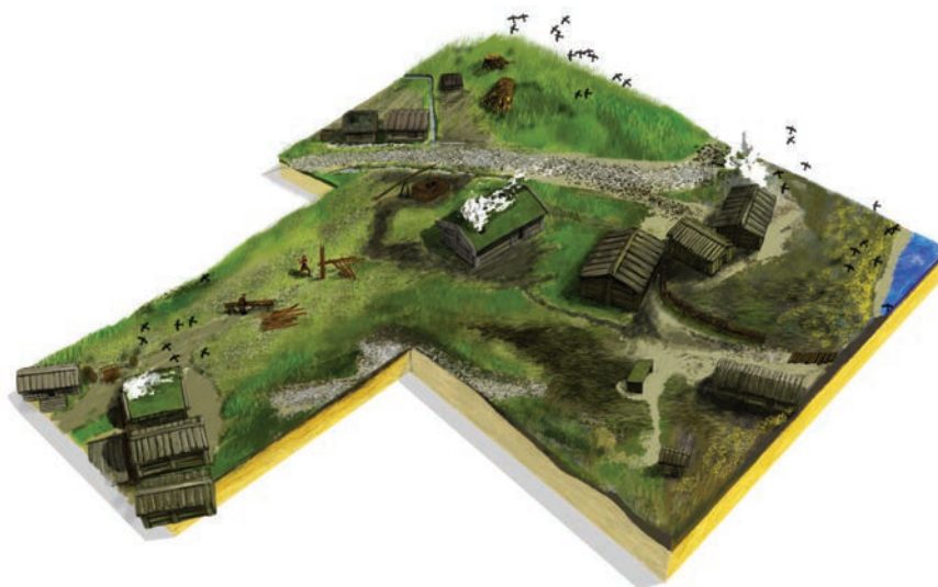
Figur 4: En vy över kvarteret Fältskären som det kan ha sett ut under huvudskede 4. Illustration Sverker Holmqvist, Arkeologikonsult.

En av de platser som uppvisade stora likheter med kvarteret Fältskären vad gäller tidsdjup och geografiskt