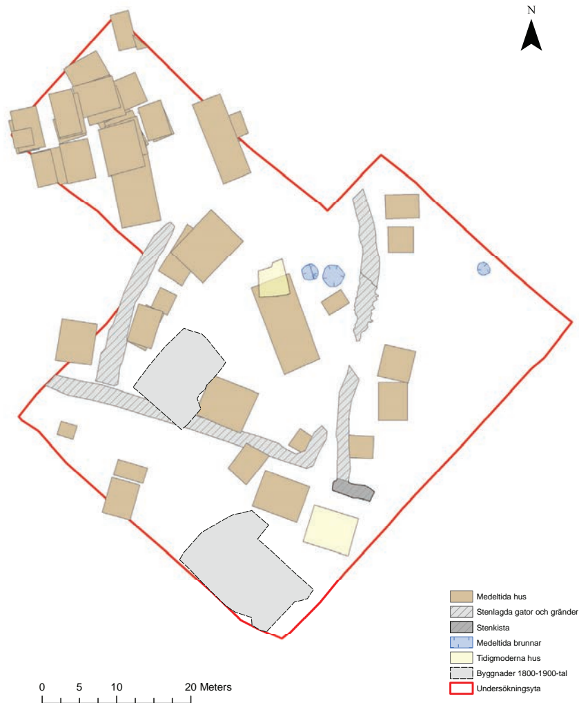
Figur 1: Översikt över de arkeologiska lämningarna inom kvarteret Fältskären.

både verksamhet och sjöfart. Många av våra tidiga städer anlades i anslutning till vatten. I takt med att städerna växte blev det strandnära området i och omkring städerna allt viktigare. Beroende på topografi, vattendjup och geologiska förutsättningar gick man till väga på vitt skilda sätt men i samma syfte att förbättra möjligheten att utnyttja dess markområden. Fuktighet, över-