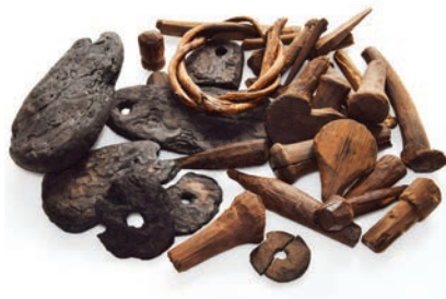
Figur 2. I utfyllnadslagren återfanns gott om föremål av trä, bark och näver.

I kvarteret Fältskären fylldes det strandnära området ut med organiskt avfallsmaterial från staden tillsammans med avfall som genererades inom kvarteret. Dessa utfyllnadsmaterial bestod av många olika komponenter som flyttades runt, blandades om och kanske flyttades igen. Det var en del av stadens natur, den ständigt pågående processen när staden utvecklades och förändrades. Utfyllnadslagren bestod till stora delar av träavfall från byggnationer och hantverk men också av hushållsavfall och organiskt material blandat som ett mer eller mindre homogeniserat stadslager med ett arkiv över några av stadens aktiviteter.