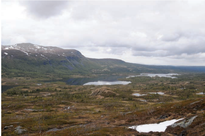
Figur 3. Offerplatsen ligger vid toppen av bergknallen och graven i ett stenskravel på den sida som vätter bort från sjön och vistena. Foto förf.