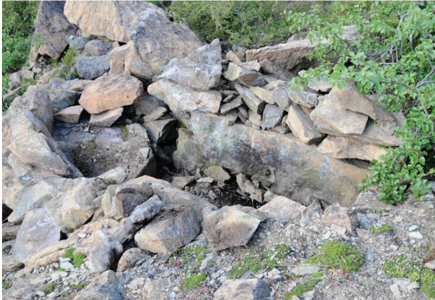
Figur 5. Graven efter att den rensats från lösa stenar.

(Jönsson 2011, s. 3-5). Den osteologiska analysen gav intressanta resultat. De flesta benen härrörde från en renkalv som deponerats innan den blivit en månad gammal. Detta betyder att offret måste ha utförts från slutet av maj till slutet av juni. Tillsammans med benen från kalven fanns även rester av en vuxen ren. Den var representerad av samtliga fyra klövar. Möjligen kan detta tolkas som att kalven lindats in i ett renskinn där klövarna varit kvar. Hela skinn har just ofta fotbenen kvar. Anmärkningsvärt är också att inga ben hade spår efter skär- eller huggmärken. Något som annars är ofta förekommande vid rendepo-neringar (Boëthius 2010). Dateringen var inte mindre intressant, 175 +/- 50 BP. Kalibrerat med två sigma ger det en tidigaste datering till 1650 och fram till nutid (LuS