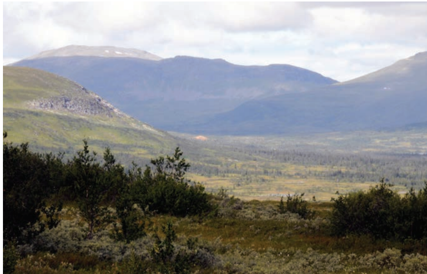
Figur 2. Vid rätt väderlek syns bergknallen på långt håll på grund av sin speciella gulaktiga färg.

Efter Sundströms artikel 1988 hände egentligen inte så mycket med skelettet från Gransjön. Det förvarades i Jamtlis arkeologiska magasin