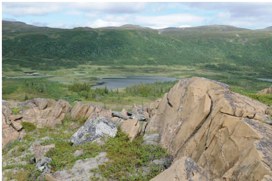
Figur 4. Från offerplatsen har man utsikt över sjön och dalgången med sina visten och renvallar. Foto förf.

samma bergknalle som graven. Till skillnad från gravplatsen har man här utsikt över hela Gransjödalen (Fig. 4). Offerplatsen bestod av en