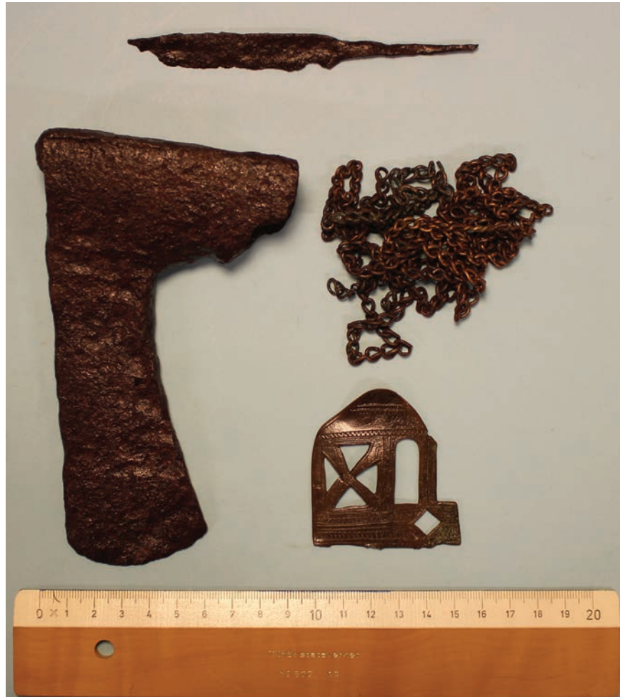
Figur 6. Samtliga föremål som påträffades i graven. Vad mässingsplåten ursprungligen varit är okänt. Nederkanten ser ut att ha brytmärken.

under en berghammer. Mellem de større stene, som omgav rummet, var der kilet ind mindre, og det hele var dækket av flate heller.” På mer än ett sätt ganska likt graven i Gransjön. Att graven från Mösjöen är intressant för Petersens artikel om björnkult är just mässingringen som fanns i graven. 1937 hade Petersen fått sig tillsänt ett björnkranium med en mässingkedja lindad runt kindbenet (Petersen 1940, s.