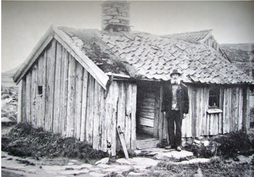
Figur 1. Torpstuga i Bohuslän, tidigt 1900-tal.

relation till årtalet 1850 är ytterst oklar. Många nya typer av fornlämningar är dessutom dåligt inventerade och registrerade, vilket innebär att de löper större risk än andra typer av lämningar att förstöras av ovarsamhet, exempelvis i samband med skogsbruk. Det finns således ett stort behov av att utveckla metoder kring inventering, registrering och kunskapsspridning om den här typen av lämningar till stora grupper, både inom och utom den antikvariska världen. Många av de här ”nya” fornlämningarna är också sådana som framför allt kan knytas till den stora gruppen obesuttna i samhället.