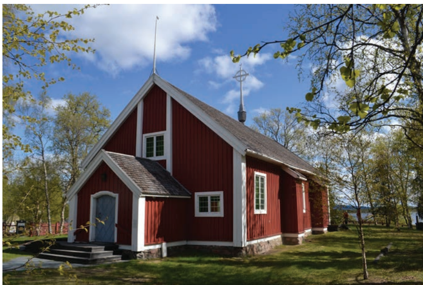
Figur 6. Jukkasjärvi kyrka, uppförd under 1600-talet.

den uppfördes. Genom koppar- och mässingshandeln och den monopolliknande positionen hade bröderna också kontroll över en av den atlantiska ekonomins mer eftertraktade varor. Mässingen såldes ofta som tråd till Nederländerna och senare till England där den blev till nålar, hyskor och hakar till korsetter och andra spännen. Fyndet av det så kallade Læsø-vraket i Öresund på 1950-talet gav en direkt bild av mässingsexporten. Stora mängder mässingstråd stämplade med familjerna De Geers och Momma-Reenstiernas vapen påträffades ombord. Skeppet hade uppenbarligen förlit på sin väg från Norrköping till Amsterdam (Helmfrid 1959; Nilhamn 2012; jfr även Zahedieh 2013).