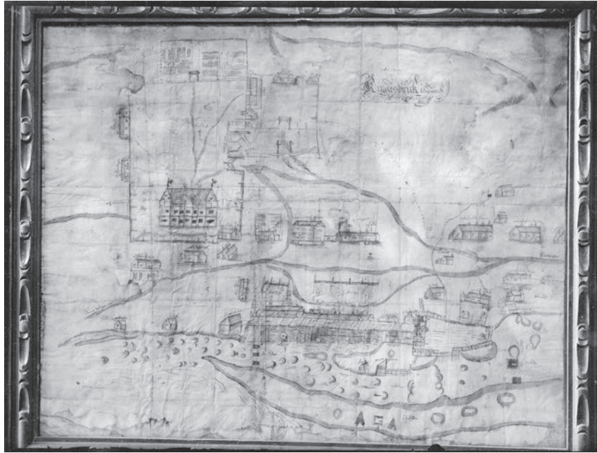
Figur 4. Teckning över Kengis bruk 1660 av Denis Joris

ningen inskränkningar i det samiska självbestämmandet (jfr Bromé 1923, s. 157–158; Nordin 2012, 2015). Det är också viktigt att komma ihåg att kronan visste att tvinga fram uppgifter om metallfyndigheter som i fallet med Sjängeli, invid Torneträsk, 1696 där fyndplatsen avslöjades efter hot om gatlopp (Wallerström 1996).