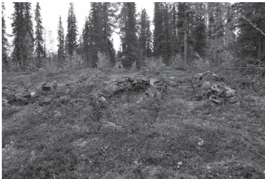
Figur 2. Leppäkoski hytta, rostugnar, Jukkasjärvi socken, RAÄ 1931 foto Jonas Monié Nordin.

Innan Lindmarks studier hade en del bergverk dragit till sig vetenskapligt och populärt intresse. Nasafjäll i Arjeplogsfjällen, Boliden, Gällivare/Jiellivárri/Jellivaara (Sv, SaN, Me), Kvikkjokk/Huhtán (Sv, SaL), hade genererat flera studier (jfr Bromé 1923; Norberg 1958; Brännman