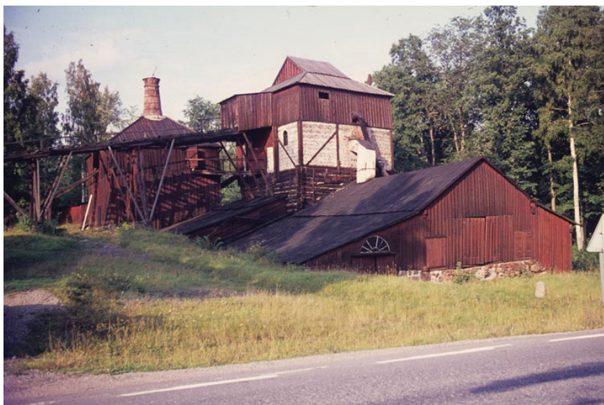
Figur 1. Engelsbergs bruk och masugn. Foto Lars Löthman, Riksantikvarieämbetet, 1960-tal

konst, arkitekturhistoria och industriarv betonades (Nisser 1996, s. 76–77). I samma skede, under tidigt 1990-tal, fick Riksantikvarieämbetet ett utökat ansvar för kunskapsuppbyggnad kring industriminnesvård (Isacson 2003). Efter en intensiv fas fältnade intresset något i Sverige, medan den anglosaxiska industriarkeologin förefaller ha behållit sin position (Symonds 2005). Inflytande från neomarxism och poststrukturalism stärkte det akademiska intresset för industrialismen som produktionsform och studieobjekt i Storbritannien och i USA. En annan skillnad mellan Norden och Storbritannien är arkeologifältets nära släktskap med antropologi men även socialhistoria (jfr Johnson 1996; Shackel 1996; Knapp et al., red, 1998). Stephen Mrozowski och James Symonds studier om klassformeringsprocesser