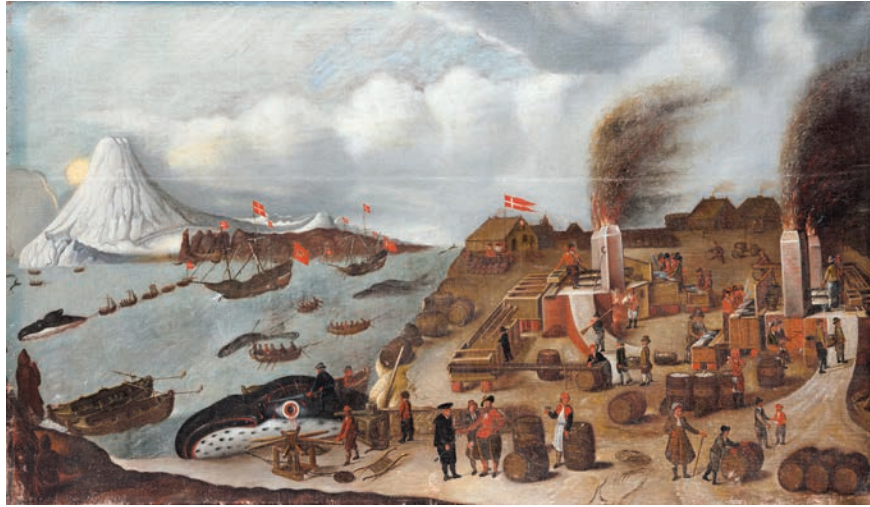
Figur 7. Dansk valfångsstation i Smeerenburg, Spetsbergen, målning av Abraham Speeck 1634 Skokloster slott, inv nr 11865. Nedanför skorstenarna i mitten och till höger i bild, syns de stora kopparkaren där valspäcket kokades.

som hade en egen järnframställning, under 1600-talet, men den europeiska kolonialismen med intensifierad slavhandel kom att skapa en ökad efterfrågan på europeiskt järn (Evans & Rydén 2018). På ett liknande sätt förhöll det sig i Nordamerika där järnföremål visserligen kunde betinga högt pris men inte i närheten av vad en koppar/mässingskittel ansågs vara värd (jfr Immonen 2013; Nordin & Ojala 2017). Den svensktillverkade kopparen och mässingen kom att utgöra inbegrepp för många handelsprojekt, vilka i förlängningen kom att få omvälvande sociala och demografiska konsekvenser för Amerikas och Afrikas ursprungliga befolkning.