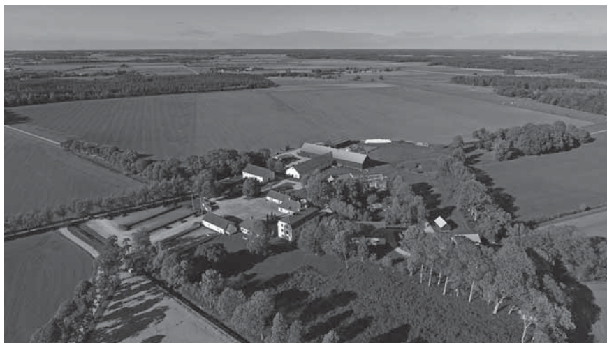
Figur 1. Gutnaltingets samlingsplats har sannolikt legat i den så kallade Guldåkern på höjdsträckningen norr om Roma kungsgård och klosterruinen. I bakgrunden den uppodlade före detta insjön Roma myr.