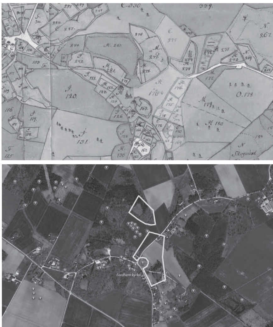
Figur 7a och b. På en höjdstreckning norr och nordöst om Fardhem kyrka finns på skattdokumenteringen Tingz-Ruhm, Tingzängen och Tingzkull åker. Ågorna var delade mellan fem gårdar, bland andra Prästgården. Här låg ett stort gravfält med rötter i bronsåldern, som det bara finns spillror kvar av idag. Dåvarande prästen uppgav år 1799 att han "upprivit många hedna rör och gravar, bortfört 1000:de tals lass sten till anlagde gärdsgårdar och där funnit de rör som haft över 800 lass sten i sig" (Östergren 2018, s. 51). Fardhem var en av Gutalagens tre asylkyrkor. Kartorna är hämtade ur Östergren 2018.

ägospplittring. Tinget tycks ha tagit förhållandevis stora ytor i anspråk. Kriterierna för de gotländska tingsplatserna är i stort sett desamma som för tingsplatserna i övriga Norden. Vid ett seminarium i Visby den