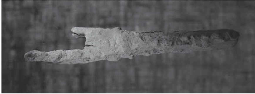
Figur 7. Parerstång till svärd (F8) från undersökning i augusti 2008.

ment, sex spjut- eller lansspetsar, 12 sporrar, nio mestadels små järnprojektiler, 20 små mestadels kvadratiske blyprojektiler, 10 ringbrynje-fragment samt armborstfragment, spetsar till spikklubbor, stridsknivar, pilspetsar och rustningsdetaljer i form av lameller, söljor och beslag samt enstaka fynd av personlig utrustning. Resultaten har redovisats i årsrapporter (Lingström 2007–2019, se www.masterby1361.se , samt www.samla.se ). Slagfältsfynden har paralleller till Korsbetningen, men kompletterar lika ofta detta material, inte minst när det gäller vapen. Inga vapenfynd har gjorts i gravarna i Visby. Mästerbyfynden utgör därmed en mycket viktig för-stahandskälla till information om den danska invasionen år 1361. Sammantaget gör fynden och deras spridning att vi näst intill minut för minut kan följa striderna mellan gotlänningarna och den danska armén.