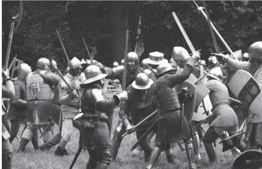
Figur 10. 2013 års reenactment i Mästerbyängen. Fyra reenactments har under åren 2011–2019 arrangerats. Flera hundra deltagare från upp till 20 länder, och en publik på upp till 2000 personer per gång visar på intresset för återskapandet av stridigheterna i Mästerby.

vi i myrens smalaste parti ser tecken både på distansstrid och närstrid: en distansstrid där gotlänningarna fattat posto norr om myren och danskarna anföll från området söder om myren. Gotlänningarna lyckades i detta skede pressa tillbaka den mindre styrka som danskarna först skickade ut på myren. Det är därför vi även ser tecken på närstrid, i form av delar av vapen, inom denna del av slagfältet. Då danskarna satte in hela sin styrka av yrkessoldater var dock gotlänningarna chanslösa. Danskarna tog sig över myren och ut på bredd. Sedan var utgången given och vägen mot Visby låg öppen.