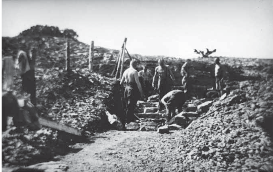
Figur 6. Arbeta pågår med att färdigställa minnesmärket i Katthammarsviks militärförläggning sommaren 1945.

bara var av olika nationaliteter utan också tillhörde olika politiska schatteringar. I de förhör som hölls med de lettiska flyktingarna i förläggningen uppgav några av dem att det i lägret fanns ett par personer, som arbetat som agenter åt tyska polisorganisationer och som hindrat, angett eller på olika sätt motarbetat människor som engagerat sig i den lettiska motståndsrörelsen eller som planerat att fly till Sverige. När de utpekade männen förhördes förklarade de sig dock dessa vara oskyldiga till anklagelserna. 11