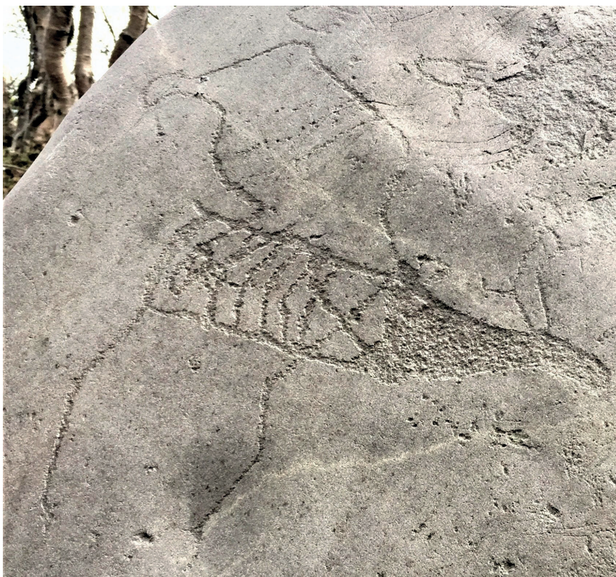
Figur 6. En bjørn som angriper en rein? Bjørnehodet er plassert i reinens skulderparti. Over bjørnen er det to bjørnespor med klør. Motivet kan også tolkes som en symbiose mellom rein og bjørn der begge dyrene blir oppfattet som like viktig for menneskene. Helleristningen er nylig funnet på Isnestoften i Alta kommune, datert til 5000–4000 BCE.

stor bestand i Nord-Norge utover 1500-tallet, som bekreftes i kildene til presten Peder Claussøn Friis (1545–1614). Hans beskrivelser av natur og folkeliv i Norge er fra hans samtid. I avsnittet om Lofoten og Vesterålen heter det: « (...) saa mange biørne at ei ere saa mange i nogit læn i Norig, oc giøre stor skade, særlig på queg, men ocsaa paa fisk oc tran. Thi hand ri-fuer fisk ned aff deris fiskehjalde (...) » Så en organisert bjørnejakt av kyn-dige jegere var sannsynligvis sett på som en nødvendighet (Storm 1881, s. 375)