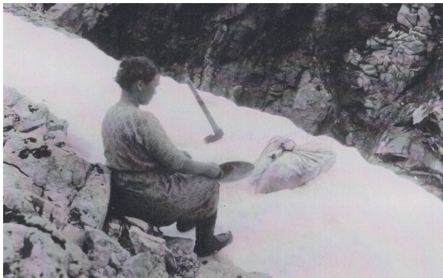
Figur 6. Mat som ska bevaras i snölega på sommaren.