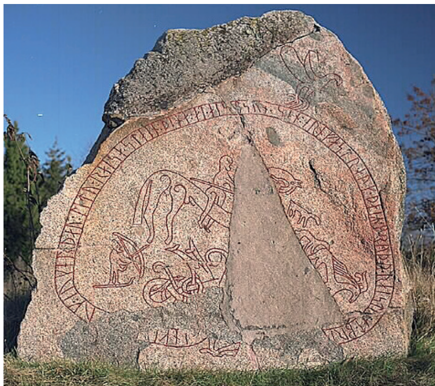
Figur 5. Runsten vid Böksta, Balingsta sn, Uppland, omkring 1050 e.v.t. En skidåkare med båge står nere i vänstra hörnet. Foto Bengt A. Lundberg, Riksantikvarieämbetet. Creative Commons Erkännande 2.5 Sverige (CC BY 2.5 SE)

till häst med ett spjut samt en annan man, som har en båge i sin ena hand och en stav i sin andra. Han är något större än ryttaren, och står på en linje, "steht auf einer ansteigenden Standlinie" (Hauck, Axboe et al. 1985a, s. 330). Kent Andersson skriver om "en figur med en pilbåge eller möjligen en stav i handen ... mannen tycks stå på ett par skidor ... en lokal hövding ... (eller) ... en allegorisk figur som ... visar att ryttaren besegrat en stam eller grupp som använde sig av skidor?" (Andersson 2020, s. 49).