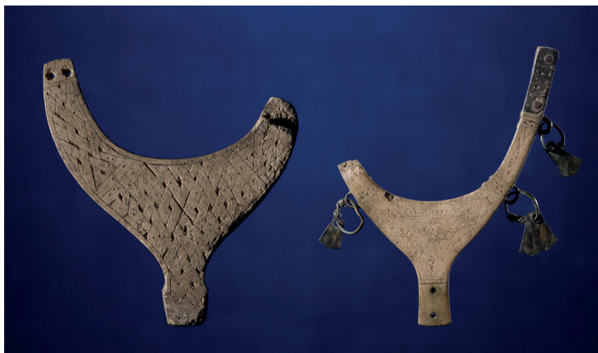
Figur 4. Två föremål av horn, ornerade med flätbandsmönster, från Vestvatn i Misvær och Eiterjord i Beiarn, Nordland, Norge, vikingatid-tidig medeltid. https://www.unimus.nol/felles/bilder/web_hent_bilde.php?id=14291664&type=jpeg Foto: Adnan Icgic ©2020 Tromsø Museum, UiT / CC BY-NC-ND 3.0. Fotot tillgängligt (open access) genom de norska landsdelsmuseernas databas, http://www.musit.uio.no/artefacts/tmul/search/?oid=27677&museumsnr=Ts6251&f=html .

täljstensföremål kom fram, bland annat tio skaft till grytor, varav sex ornerade, tre på vardera platsen; de är snarlika de långsmala skaften från Arjeplog sn.