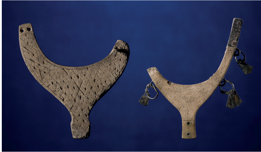
Figur 4. Två föremål av horn, ornerade med flätbandsmönster, från Vestvatn i Misvær och Eiterjord i Beiarn, Nordland, Norge, vikingatid-tidig medeltid. https://www.unimus.nol/felles/bilder/web_hent_bilde.php?id=14291664&type=jpeg Foto: Adnan Icgic ©2020 Tromsø Museum, UiT / CC BY-NC-ND 3.0. Fotot tillgängligt (open access) genom de norska landsdelsmuseernas databas, http://www.musit.uio.no/artefacts/tmul/search/?oid=27677&museumsnr=Ts6251&f=html .

täljstensföremål kom fram, bland annat tio skaft till grytor, varav sex ornerade, tre på vardera platsen; de är snarlika de långsmala skaften från Arjeplog sn.