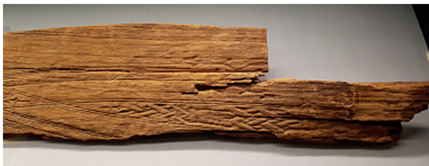
Figur 1. Skidan från Brännbacken, Arjeplog, Lappland.

Samer var berömda skidtilverkare, troligen redan på järnåldern. En man har under vendeltid (550–750 e.v.t.) begravts vid stranden av Stora Drocksjön, i gränstrakterna Härjedalen-Hälsingland, med sju små hyveljärn, lämpliga för att hyvla trä till skidor. Fynd av det här och liknande slag betraktades först som depåfynd, innan man insåg att det rörde sig om gravar (Sundström 1989, s. 23–30; Holm 2016).