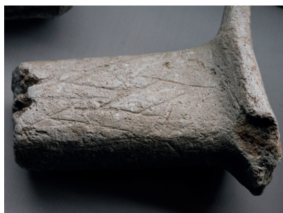
Figur 3. Bandflättningsmönster på handtag till täljstenskärl från Skueggesholmen, Arjeplog sn.

typ C:4 4 exemplar, Finland och Sverige 2 vardera. Anmärkningsvärt är att orneringen är vanligast på typ C:2, med ränna, i Finland och på typ C:1, utan ränna, i Sverige. ... flätmönster på 18 exemplar: Finland 9, varav 1 C:1 och 8 C:2; Sverige 9, varav 7 C:1, 1 C:2 och 1 C:3. ...”.