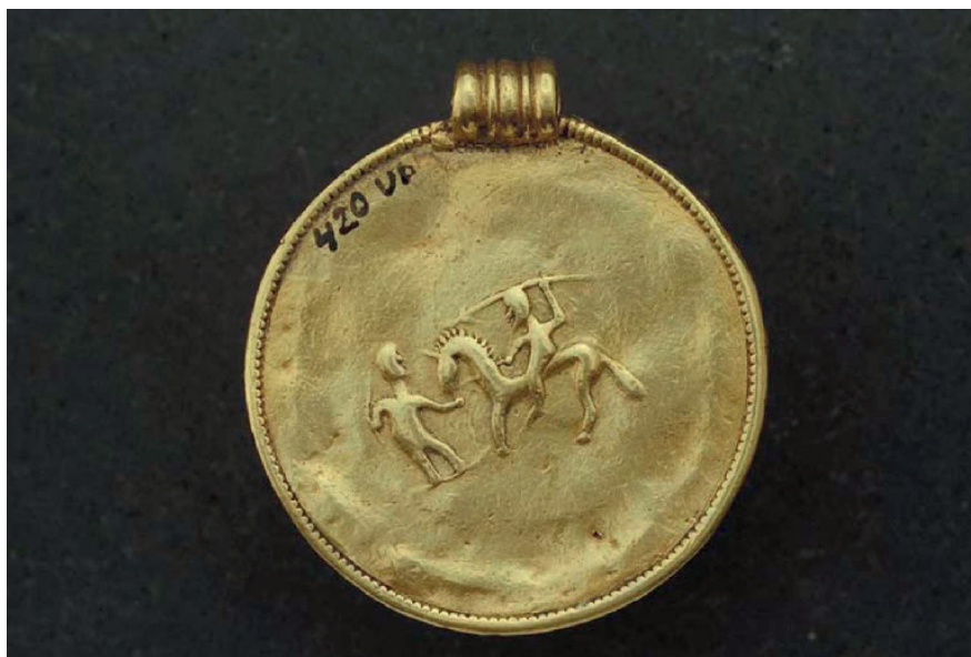
Figur 6. Medaljong av guld från Tunalund, Hjälsta sn, Uppland. Baksidan visar en ryttare och en bågskytt, möjligen på skidor. Romersk järnålder. Foto Ulf Bruxe, Historiska museet. Creative Commons Erkännande 2.5 Sverige (CC BY 2.5 SE)

att platsen hade hög status redan under äldre järnålder (Andrén 2020; Vikstrand 2001, s. 166, 188, 413; Andersson 1997, s. 237; Zachrisson 1997a, s. 173).