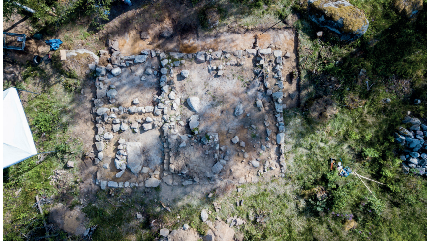
Figur 3. Drönbild över husgrunden på "Lappatäkten". Till höger i bild, syns grunden efter storstugan med spisröset i vänstra hörnet, kammare och farstu till vänster (spridningstillstånd LM 2019/020491).