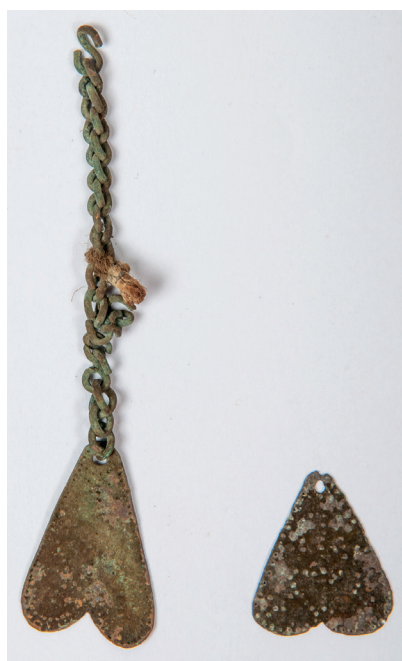
Figur 4. Hängen av kopparlegering påträffade vid undersökningen av stugan i Lappatäkten.