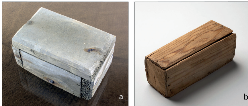
Figur 2 (a) Den stängda asken från Gällared innehållandes det svepta fostret (10,7 x 6,8 x 5,3 centimeter). (b) Asken från Bringetofta (15 x 6 x 6 centimeter).

att detta måste ske med hänsyn till de etiska aspekterna och i en respektfull dialog med kyrkans företrädare. Här utgör undersökningen av fosterbegravningen i Gällared ett exempel på hur det går att samarbeta och nå lösningar som är godtagbara för såväl arkeologer som kyrkan.