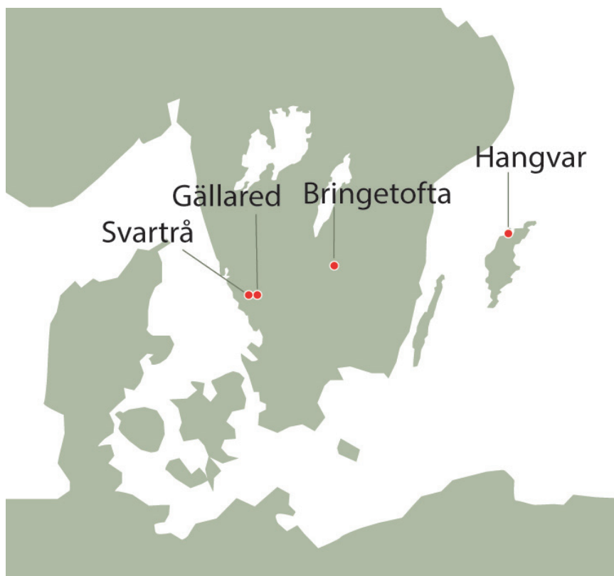
Figur 1. Karta med Gällared, Bringetofta, Hangvar och Svarträ kyrkor utmärkta. I de tre första kyrkorna har fosterbegravningar hittats och från Svarträ kyrka finns ett historiskt dokumenterat exempel på hur en hemlig fosterbegravning kunde gå till. (Karta: Anders Andersson, Kulturmiljö Halland).

I likhet med andra typer av efter- reformatiska gravar inne i kyrkor, kryptor och kapell har kategorin fosterbegravningar inte självklart klassats som en fornlämning, och det är långt ifrån givet att de un- dersöks av arkeologer. I vissa fall har kyrkans personal identifierat askarna som begravningar, och återbegravt dem på kyrkogården utan att kon- sultera museerna (Hagberg 1937, s. 510; Bø 1960). Fallstudierna som beskrivs i den här artikeln visar på värdet av noggranna undersökningar av fosterbegravningarna, men också