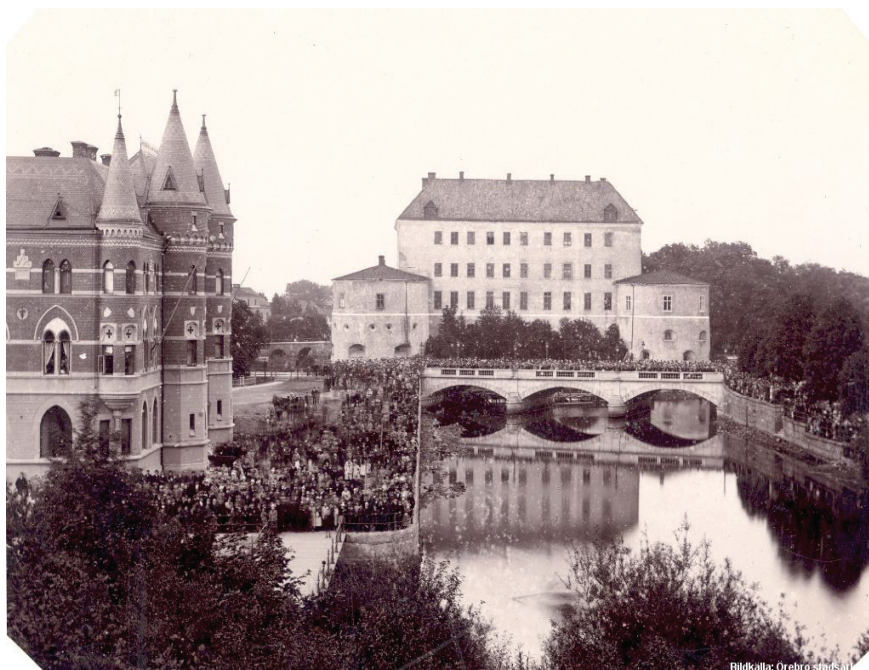
Figur 2. År 1895 går man och kvinna ur huse när det är ballonguppstigning i Örebros "finrum" med Svartån, Stortorget och slottet i dåvarande stil. Till vänster den då nybyggda Allehandaborgen. Bakom den skimtar Teaterplan.

rörde sig om ett omlagrat stadslager med inslag av köks- och latrinavfall (Balknäs 2021, s. 20–21). Till fassen räknades även en träbyggnad på stensyll som kunde ^{14}\text{C} -dateras till 1478—1637 e.Kr. Det kan därmed ses som tänkbart att de båda byggnaderna varit i bruk samtidigt.