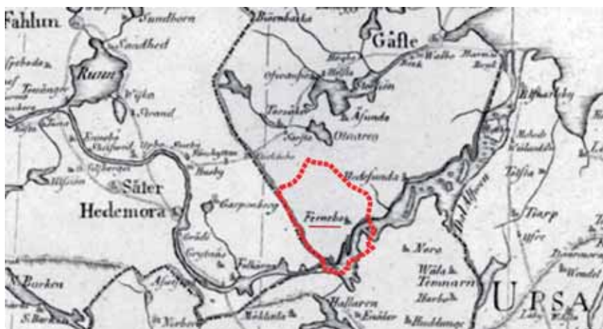
Figur 1. Österfärnebo ligger vid nedre Dalälven och i sydligaste Gästrikland. Närmaste grannsocknar är i norr Torsåker och Årsunda, i öster Hedesunda, i söder Nora och i väster By. Bildunderlaget är en landskapskarta från ca 1795.

batter i sockenstämman togs 1796 beslut om en ny kyrka. Men kort därefter drabbades bygden av flera missväxtår och därpå utbröt ryska kriget. Bygget drog ut på tiden. Det var i stort sett klart 1822 men invigningen kunde äga rum först 1827. Den medeltida kyrkan fick stå kvar strax intill den nya till 1830, då den revs.