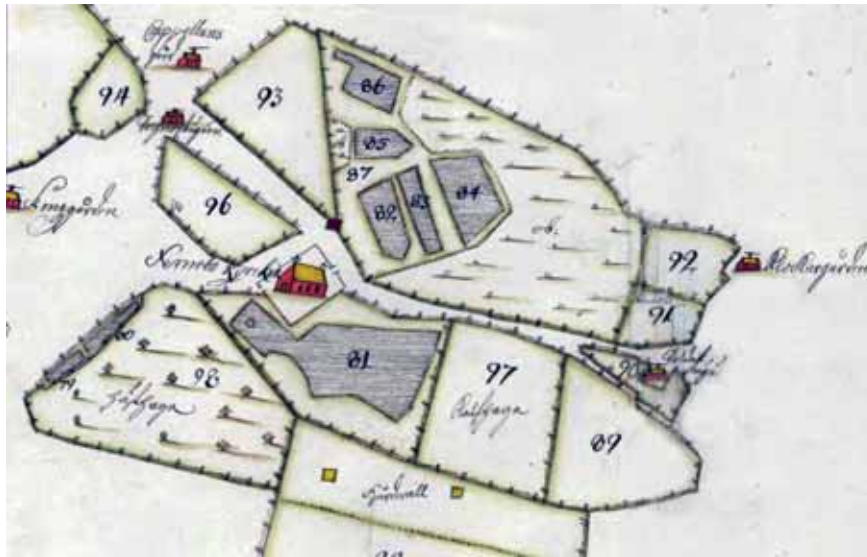
Figur 3. De vretar (numrerade 79–86), som på denna lantmäterikarta från 1701 omger (den 1830 rivna) kyrkan, anges som Österfärnebos första och äldsta prästbord. Vid sockenbildningen tilldelades prästgården betydligt mer åker och äng. De visar att också 1200-talskyrkan haft äldre föregångare. (Detalj.) Lantmäteriets arkiv.

Dessa jordstycken, som prästen förfogat över, fria från skatt, hade då länge varit föremål för böndernas missnöje. För som nyss nämnts hade prästgårdens ägor i samband med by- och sockenbildning utökats betydligt och omfattade halva byn Klappsta. Tvister mellan byns skattebönder och prästen hade upprepade gånger varit rättssaker. En dom från 1379 (SDHK 10031) är den äldsta kända. Den gick bönderna emot eftersom de ansågs på olika sätt ha åsidosatt prästgårdens rättigheter. Grunden för utslaget var just att byn var delad (Thulin 1904: 93–99; Hedblom 1958: 110). Senare lantmäterikartor bekräftar förhållandet (Prästbordet, Geometrisk avritning, 1701, LMa; Klappsta 1-6,