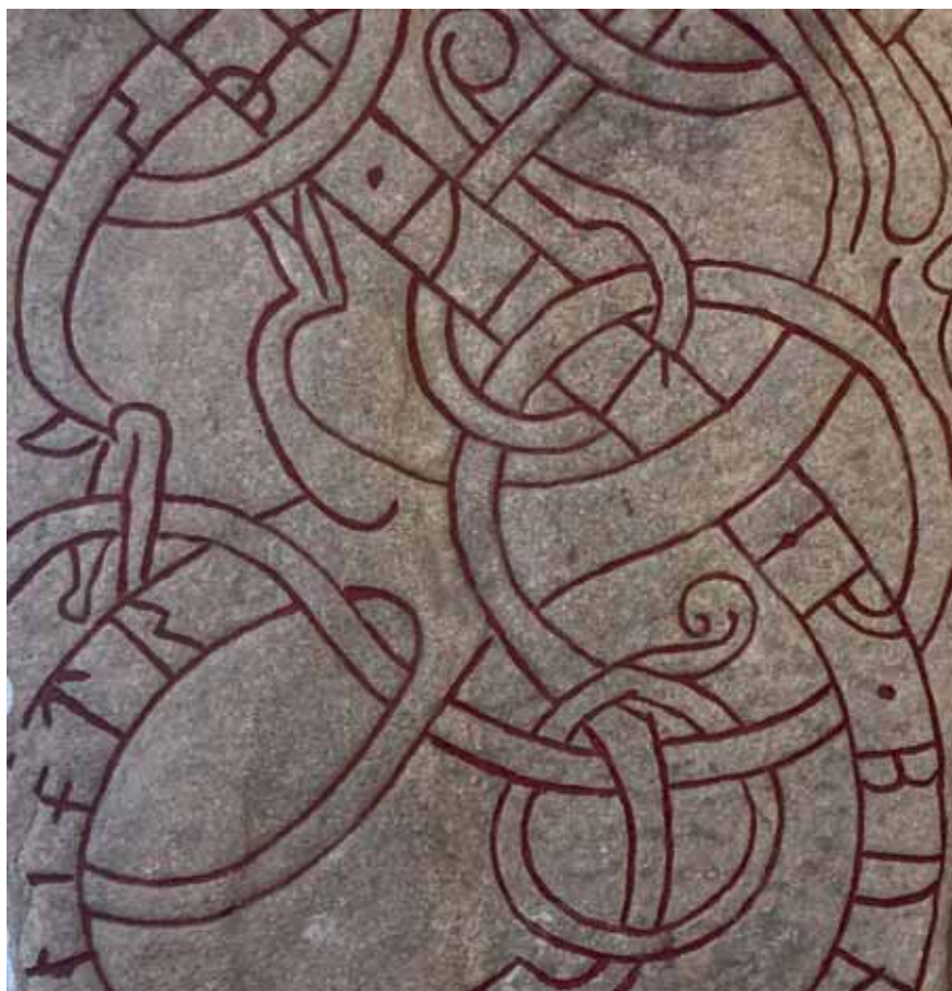
Figur 2. Önjut ristade denna runsten (Gs 1), som sannolikt ursprungligen stått på Vilevs grav på den första kyrkogården. Hans änka, Snölög, lät resa den. Stilen daterar stenen till ca 1070–1100. Den står nu i kyrkans vapenhus. (Detalj.)

skription. Texten har tidigare för övrigt betecknats som en nonsensinskrift, det vill säga att en icke-runkunnig person velat efterlikna runor (GR). Å andra sidan är den i fråga om material och storlek snarlik Gs 2 och att den en gång varit en parsten eller pendang till denna är en möjlighet att räkna med.