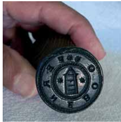
Figur 6. Stampen till Österfärnebos socken- sigill stals 1813, samtidigt med kyrksilvret, men kom tillbaka 1956 och är åter i församlingens ägo.

Idén om att Barbara kan ha varit Österfärnebos kyrkohelgon har på senare år förts fram av ovannämnde Tord Andersson, samme forskare som först uppmärksammade pro-