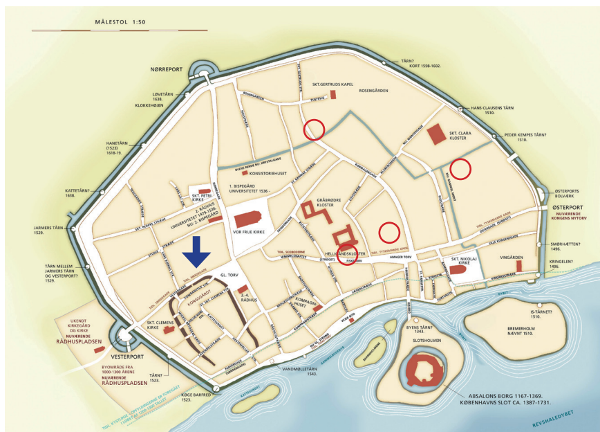
Figur 1. Rekonstruert kart over København med et utvalg av kjente bygninger og anlegg under høy- og senmiddelalderen. «Clemensstaden» og halvkrets-vollen er markert med en blå pil innenfor den sørvestlige delen av byen. Hentet fra Fabricius 2021, s. 106–107. Gjenbruk godkjent av forfatteren.

9–10 m bred og opptil 1,25 meter høy jordvoll bygget av naturlig leire og moldjord i ulike sjikt. Grøften på utsiden skal ha vært 8 meter bred og på enkelte steder mer enn 3 meter dyp (jf. Rosenkjær 1906, s. 48; Ramsing 1908, s. 411–413 og 422; 1910, s. 500; 1940, Bd. I, s. 42 og 82; Bd. III, s. 48–49) (Fig. 2).