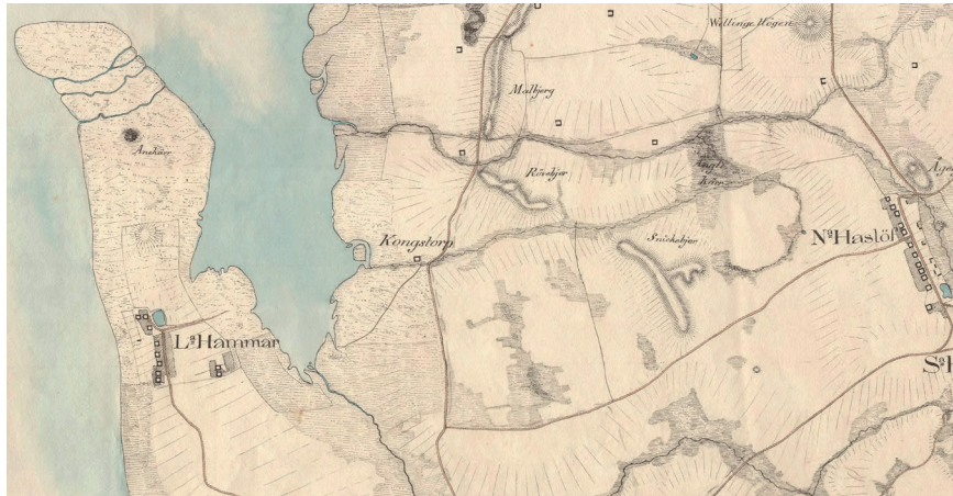
Figur 7. Snickebjør mellom Foteviken og Norra Haslöf. Nærmere Foteviken ligger Kongstorp (Stora Hammar 22:1), en gårdstomt og gård som skal ha blitt lagt øde på 1300- og 1400-tallet. https://sok.riksarkivet.se/Home!/?postid=Arkis+30c3c29b-cbdb-479a-b715-9102997bd90&flik=1&s=Balder