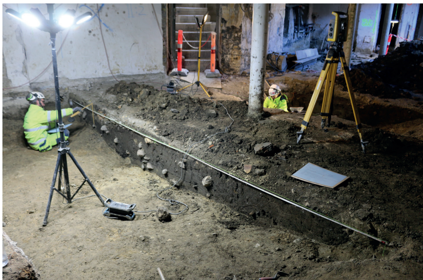
Figur 3. Undersøkelse av de nederste delene av vollgraven i kjelleren til Frederiksberggade nr. 2.

vergade og Kompagnistræde, selv om geologiske undersøkelser og koteforhold antyder at den tidligere høyvannlinjen har vært mer ujevn enn tidligere antatt (Rohde 2023). 3