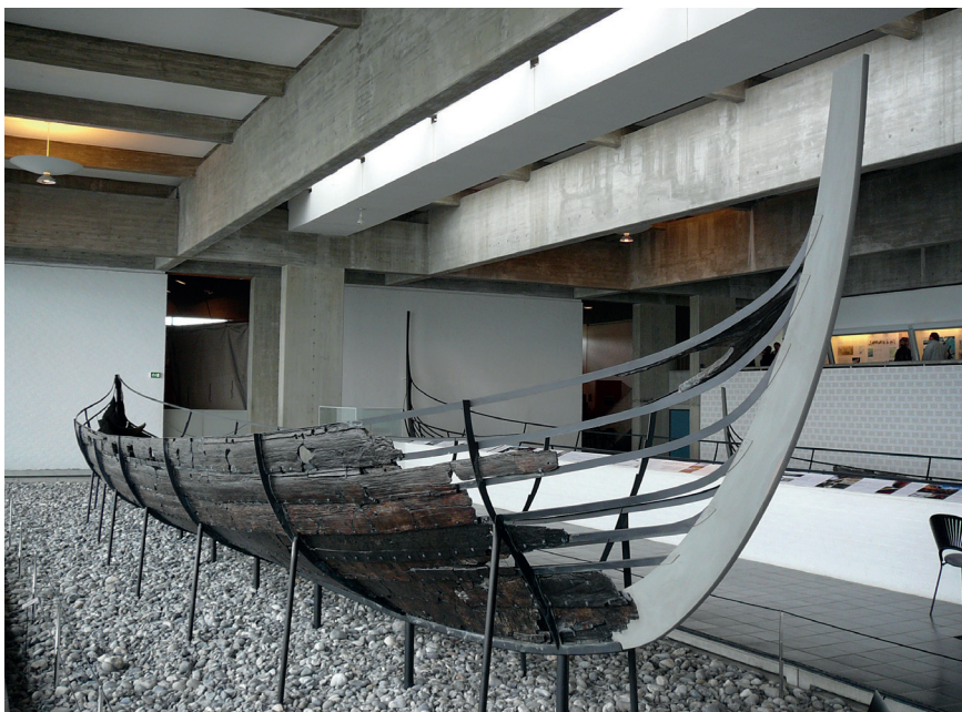
Figur 6. Skuldelev 5. Et mulig leidangsskip fra ca. 1030.

I de skriftlige kildene er organiseringen av leidangen i Danmark beskrevet i detalj i Skånske Leidangsret og Jyske Lov fra første halvdel av 1200-tallet. Distriktet som utrustet leidangsskipet kaltes på dansk for skipæn , av gammeldansk skipa , å ordne, på norsk skipreide . Ifølge Adolf Schüek var Danmark på 1200-tallet inndelt i over 700 skipen ( skipæn ), hver med 40 eller 42 roere og en styrmann (Schüek 1950, s. 119). En skipæn ble i sin tur inndelt i et ukjent antall mindre regioner og delområder kalt havner ( hafnæ ) som skulle svare for hver sin stridsdugelige besetningsmann, en roer eller havnebonde , til leidangsskipet og utstyre ham med våpen og proviant. Antallet havner per skipæn virker på denne tid å ha variert. De tallene