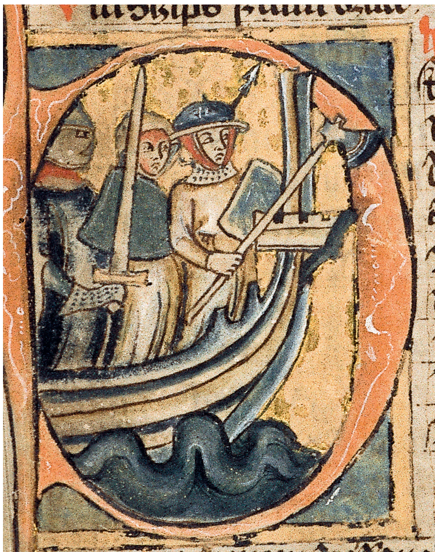
Figur 8. Leidangsskip med væpnet mannskap illustrert i initialen til Landevernbolken i Landsloven i Codex Hardenbergianus fra første halvdel av 1300-tallet. Illustrasjon hentet fra Helle 2021. Gjenbruk godkjent av Skald Forlag.

Hafn velger å oppføre en ny borg på Strandholmen – en forsvarsborg som dermed kom til å avløse en mulig kongs- eller forvaltningsgård med tilhørende halvkretsvoll på stedet. De nybygde riksborgene ble knute-