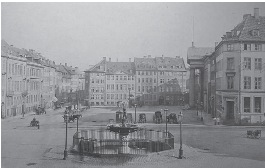
Figur 4. En god illustrasjon over de terrengvariasjoner som faktisk fortsatt finnes i Københavns indre by – Nytorv sett fra Gammeltorv.