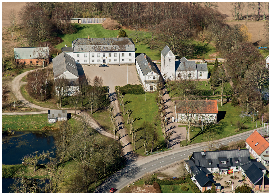
Fig. 5. Stora Herrestad kyrka med ett gårdskomplex i väster. Det såg kanske inte så ut exakt så här på medeltiden men sätesgården från 1700-talet antas ha en medeltida föregångare. Intressant är hur längorna orienterar sig mot varandra, inte mot kyrkan som fallet är i Dalby.

hem medan en stenkällare intill S:t Jørgensbjerg i Roskilde ses som en stormansgård i stället för ett kloster, trots att ett sådant nämns i skriftliga källor (Stiesdal 1980, s. 167; Andersen & Nielsen 2000, s. 121–143; jmf. Nyborg 2004, s. 127; Wienberg 2010, s. 22). Återigen försvinner de alternativa tolkningarna i en diskurs som fokuserar på den världsliga makten.