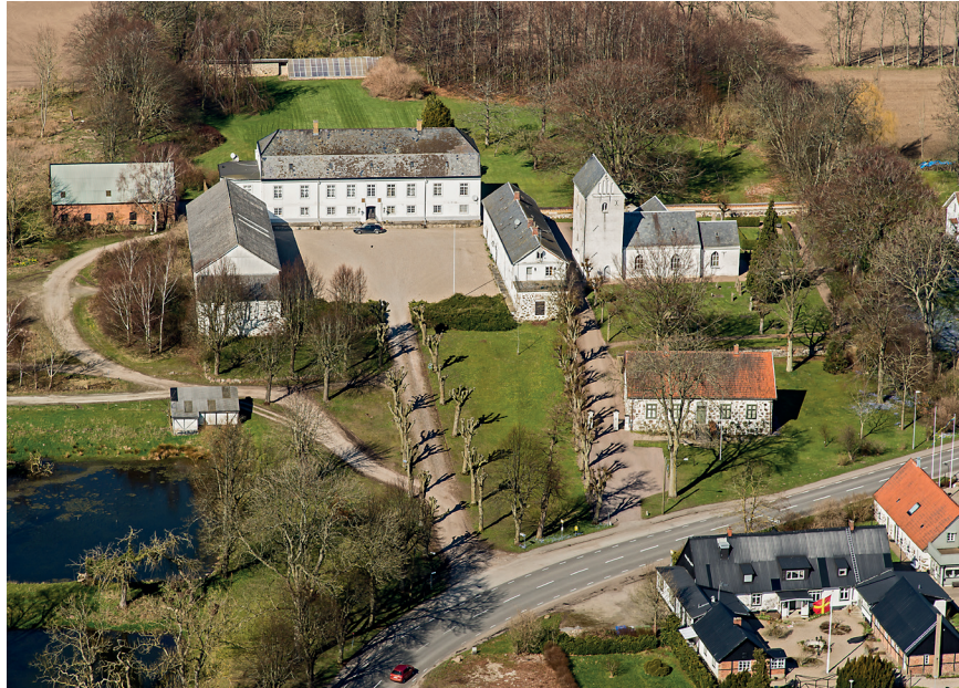
Fig. 5. Stora Herrestad kyrka med ett gårdskomplex i väster. Det såg kanske inte så ut exakt så här på medeltiden men sätesgården från 1700-talet antas ha en medeltida föregångare. Intressant är hur längorna orienterar sig mot varandra, inte mot kyrkan som fallet är i Dalby.

hem medan en stenkällare intill S:t Jørgensbjerg i Roskilde ses som en stormansgård i stället för ett kloster, trots att ett sådant nämns i skriftliga källor (Stiesdal 1980, s. 167; Andersen & Nielsen 2000, s. 121–143; jmf. Nyborg 2004, s. 127; Wienberg 2010, s. 22). Återigen försvinner de alternativa tolkningarna i en diskurs som fokuserar på den världsliga makten.