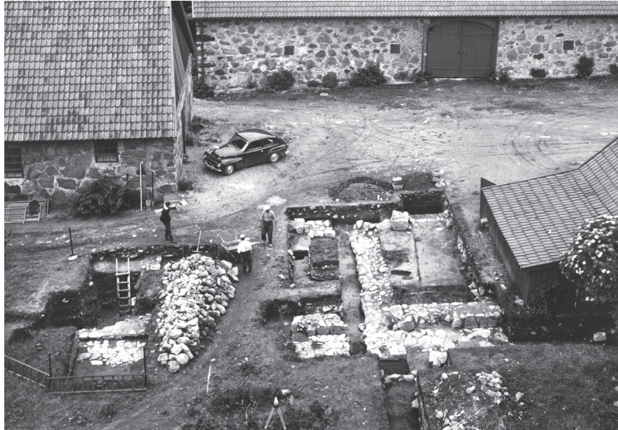
Fig. 1. Utgrävningen av den västra längan, sedd från kyrktornet mot väster. Här syns kalkstensplattorna framför murarna (Andersson 1970).