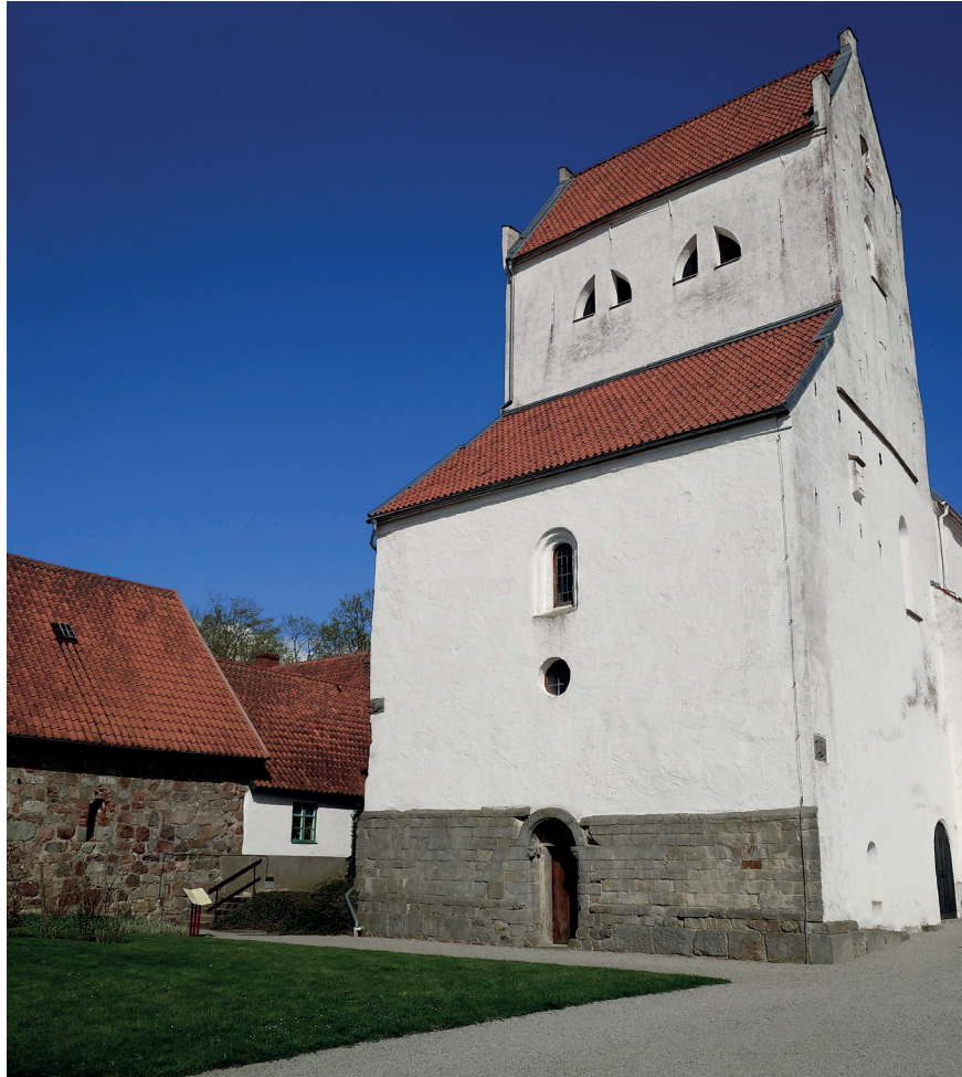
Fig. 4. Dalbys västtorn. Den numerade igenmurade högt sittande västportalen finns bakom det runda fönstret. Var detta en ingång till en kunglig loge eller hade tornrummet en funktion kopplad till klostret? Bilden är tagen ungefär där den södra längan en gång fanns. På bilden syns även en del av en medeltida byggnad som möjligen kan ha varit den norra längan i ett atrium (Wienberg 2010, s 30).

stämmer väl in på diskursen kring västtorn.