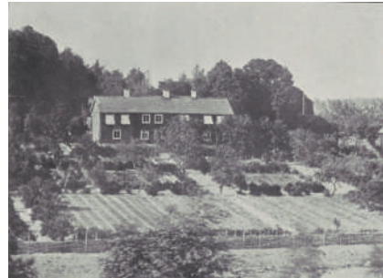
Figur 3. Stenbro prästgård (Södermanland) med typisk nyttoträdgård, troligen 1860-tal.

Vad däremot förändras i prästgårdarnas trädgårdar under perioden efter 1600-talet är själva utformningen. Från att ha utgjort en nyttoträdgård med motsvarighet i bondgårdarnas kålgårdar (fig. 3) blir prästgårdsträdgårdarna under 1600- och 1700-talet alltmer inspirerade